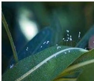
美国加州费利蒙市发 现的优昙婆罗花