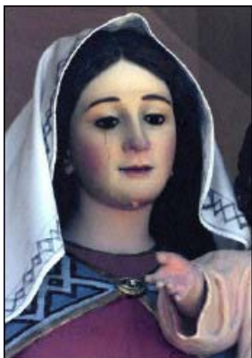
流泪的圣母像， 澳大利亚

据《塞浦路斯邮报》报道，二零零零年十二月，塞浦路斯南部利马索山区的阿拉卡帕斯教堂收藏的一幅圣母玛利亚画像，从圣诞节开始连续流了三天眼泪，教堂神父及地区主教均亲眼目睹该异象。