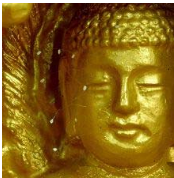
韩国顺天市须弥山禅 院，菩萨像面部开放的 优昙婆罗花