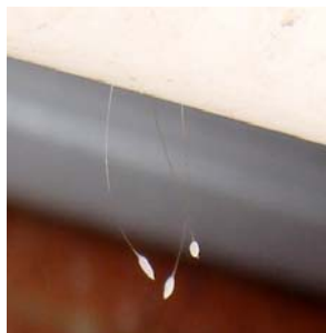
澳大利亚悉尼市发 现的优昙婆罗花