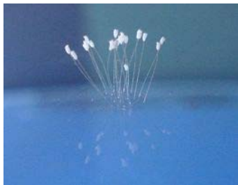
中国山西太原市发现的 优昙婆罗花。

放。佛经中说，优昙婆罗花三千年一开，花开之时为转轮圣王下世传法度人之时。《圣经——启示录》也提到，拯救大难的万王之王来自东方。