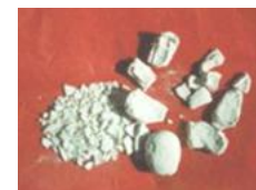
（附图为结石挤碎后的照片）