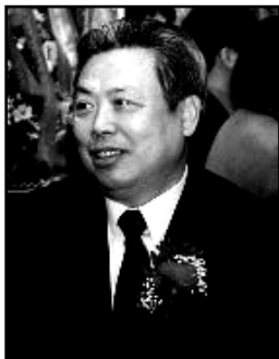
中共纽约总领事 彭克玉

【明慧网】据“追查国际”提供的电话采访录音证实，中共驻纽约总领事彭克玉承认中领馆确实参与和策动了最近发生在纽约法拉盛的围攻退党中心义工事件。中共为转嫁严重的政权危机，尤其四川地震后揭示出的中共多次得到地震预警竟瞒而不报的恶行，而蓄意污蔑法轮功学员干扰赈灾，