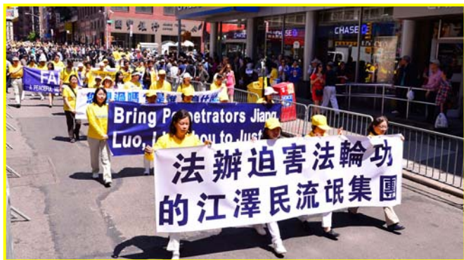
法轮功学员大游行，要求法办江泽民犯罪集团。

真心祝愿每一个善良的中国人，早日认清中共的邪恶本质，主动抛弃中共，真正拥有一个美好的未来！ 翻墙看禁书禁闻禁文禁网禁片禁歌禁曲