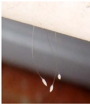
澳大利亚悉尼市发现的 优昙婆罗花