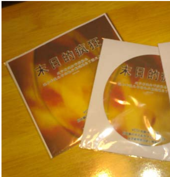
图中左侧为彩喷纸制作的标准封套