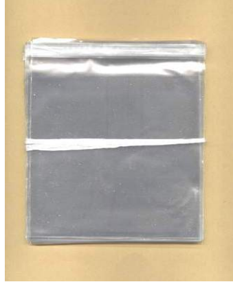
一捆光盘塑料自封袋