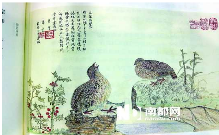
吴官正铅笔画《良官赋》。

“闲时走走、看看、想想、议议”，正是中央政治局原常委、中纪委原书记吴官正退休生活的写照。这些所见所闻、所忆所思近日集结成册，命名《闲来笔潭》，近日由人民出版社出版发行，讲述了为官从政之道和人生哲理。