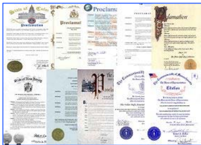
图: 2011年4月至5月,美国、加拿大部分政要颁发褒奖,宣布法轮大法日,赞颂“真、善、忍”(上图为部分褒奖状)。

二零一一年的五月十三日是第十二届“世界法轮大法日”、法轮大法传世十九周年，也是法轮功创始人李洪志先生六十华诞的日子，分布在美国10个州的24个城市宣布了该市的“法轮大法日”或