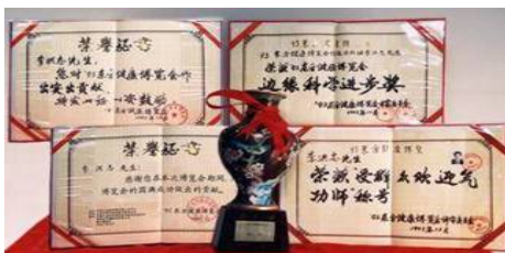
图：1993 年北京健康博览会，法轮功被授予大会唯一的最高奖：“边缘科学进步奖”，李洪志先生荣获“受群众欢迎气功师”称号。

法轮功（也称法轮大法）是一九九二年五月十三日由李洪志先生在长春市首次向社会公开传授，以宇宙特性“真、善、忍”为原则，强调重德修心，学炼者普遍身强体健、道德提升。一九九五年三月，李洪志先生应邀到法国传功讲法，开始了法轮大法在海外的传播；一九九六年李洪志先生作为“世界杰出人才”移民美国，一九九八年全家