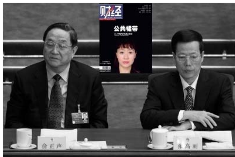
上海市委书记俞正声（左）、天津市委书记张高丽（右）与公共情妇李薇“过从甚密”。

此外，另有多名省部级官员泥足深陷“公共情妇门”，因“交友不慎”、“严重违纪”等理由调职降职或退休者，包括财政部长金人庆、国安部长许永跃、原外交部长李肇星等人。而与李薇“过从甚密”的天津市委书记张高丽、上海市委书记俞正声却未被追究。