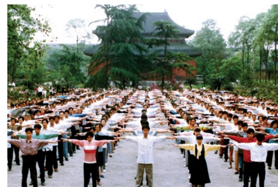
▼ 成都法轮功学员集体晨炼的场景。

包不住火，谎言终究会曝光，到了自由民主国家和地区的人们，经常惊讶地看到与中共宣传完全不一样的事实。谣言止于智者，您是否愿意敞开心扉来了解真相呢？