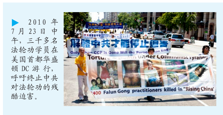
▶ 2010年7月23日中午，三千多名法轮功学员在美国首都华盛顿DC游行，呼吁终止中共对法轮功的残酷迫害。