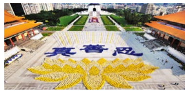
台湾法轮功学员集体炼功排字