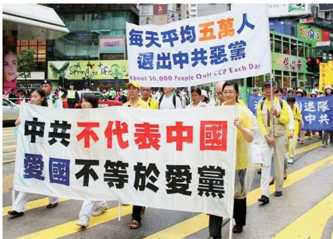
▲ 大纽约地区几千名法轮功学员及其支持法轮功的正义人士，聚集在华人社区法拉盛，举行和平反迫害大游行。

自 1999 年法轮功被迫害以来，中国灾害一年重于一年，超级天灾愈见频繁，范围与程度皆属历史少见。几十年不遇的洪水、大旱、地震、泥石流、风灾、天坑、夏雪以及各种瘟疫、人祸越演越烈，连中共官方自己都极力地掩盖其中的关联性。人不治天治，正在发生的大规模天灾，正是神在警告人迫害佛法、迫害正信所犯下的罪恶。