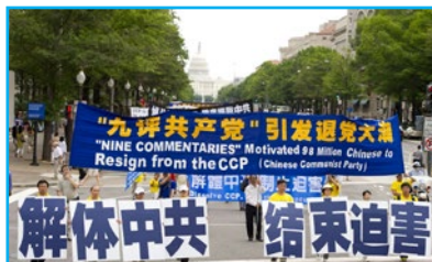
▲ 2011年7月15日，声援“三退”（退党、退团、退队）的游行队伍在美国华盛顿DC的大道上前进。

自己的收入制作真相资料；他们不求任何回报，所有的付出与努力只是为了让被中共谎言蒙蔽的人们明白真相，因为这关系到每一个生命的选择与未来。