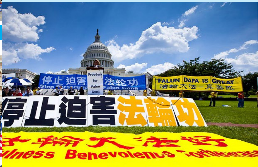
▲ 美国华盛顿民众在国会山庄前集会，要求中共停止迫害法轮功，严惩凶手，各界政要到场支持并发表演讲。