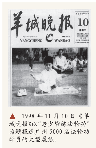
▲ 1998年11月10日《羊城晚报》以“老少皆练法轮功”为题报道广州5000名法轮功学员的大型晨练。

基于对敬天信神的敌视，共产党制造了一连串打压信仰的历史。在中国古代，上至国君、下至臣民对天地神佛都心怀敬畏，唯独中共的独裁统治，让中国传统儒、释、道三教名存实亡。有人认为现在中国人是有宗教自由的，但这只是一个假相，因为中共的信仰自由都是经过刻意挑选、经过严密的操作的，只局限于能严密控制的教会或寺庙。共产党强制推行“无神论”，对善恶标准进行随意解释，根本没有真正的“是非善恶”标准可言。而对法轮功修炼者来说，事情对错是用“真善忍”来衡量的，而这显然也成了中共控制人民“统