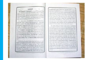
印度的学校把《转法轮》中《论语》（英文版）列为学生教材