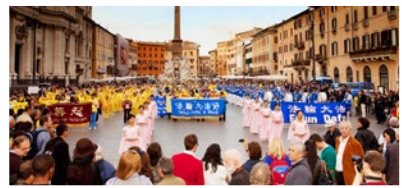
加拿大法轮功学员参加感恩节游行