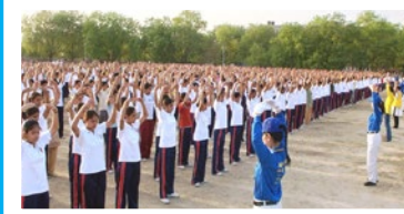
印度 80 多所学校师生学习法轮功