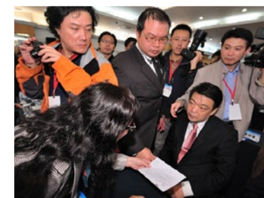
▲ 中共北京副市长吉林在数百人的会场上，对递到眼前的诉状，一脸愕然。