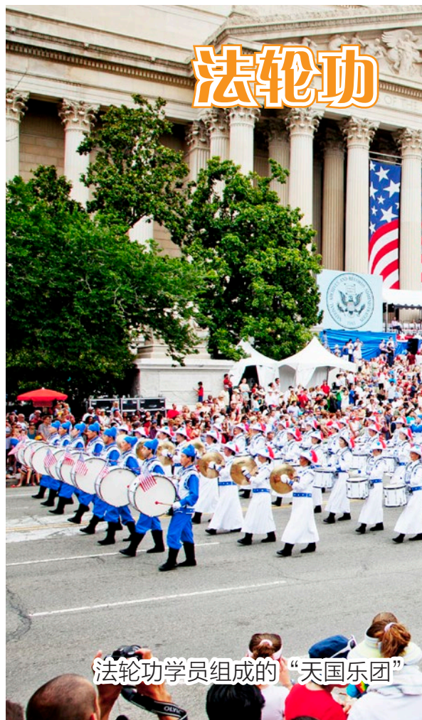
法轮功学员组成的“天国乐团”