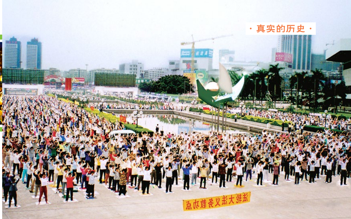
▲ 中共发动迫害之前，法轮功学员在大陆集体炼功的场面随处可见。上图为1998年，广州的一个法轮功炼功点的学员们在晨炼。

提高、身体的健康。因此在短短的7年里，大陆修炼法轮功的人数就多达1亿人，这让中共发自内心地恐惧与嫉妒。