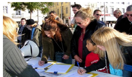
▲ 葡萄牙·里斯本·若斯奥广场

海内外上亿的修炼者共同坚守对“真善忍”的正信，持之以恒地向社会各界讲清真相。法轮功学员和平理性的抗争向世界展示了信仰的力量，觉醒的世人纷纷伸出援手，给予正义的支持与关注。下图为各国民众签名反迫害现场。