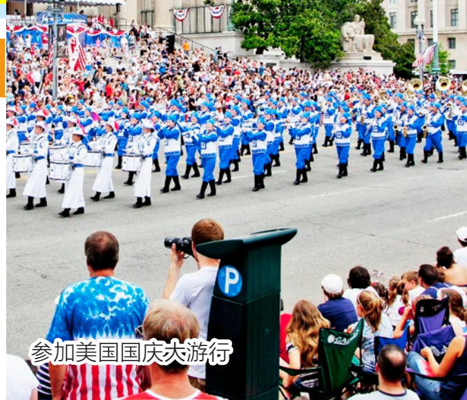
参加美国国庆大游行

害人群治罪”条例，包括（前）河南省委书记徐光春、广东省长黄华华、陕西代理省长赵正永、中共国家宗教局长王作安、湖北省“六一零办公室”头目杨松、北京副市长吉林、辽宁省省长陈政高、安徽省长王三运，以及 2012 年 2 月 16 日访台当天即被控告的北京市市长郭金龙等九人。