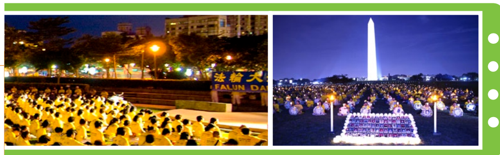
大陆被迫害致死的法轮功学员

中共的历史是一部典型的政治运动史与造假谎言史。从1949年至今，中共几乎每隔一段时间就要搞一次大规模的政治运动，每一次运动都会制造一批冤假错案，想镇压谁，就镇压谁。法轮功在中国大陆的弘传使民众们得到了道德的