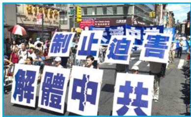
▲ 2010年9月4日，来自世界各地的法轮功学员在美国曼哈顿，举行了主题为“呼唤良知，停止迫害”的游行。

时至今日，越来越多的人明白了真相，也有越来越多的正义之士及国家纷纷谴责中共迫害法轮功的罪行。希望您能静下心来仔细思考这一切，早日洞悉谎言，明白真相，远离邪恶，拥有一个美好的未来。