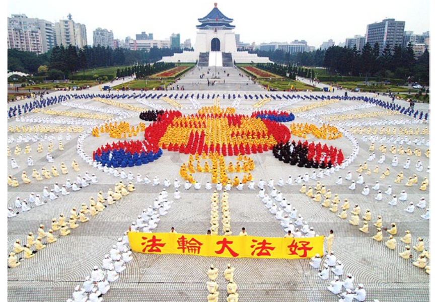
▲ 法轮功学员在台北自由广场集体炼功并排出法轮图形

2004 年 11 月，奇书《九评共产党》横空出世。书中以无可辩驳的事实，揭露了“暴力起家、欺骗成性”的中共的累累罪恶。《九评》的传世引发了脱离中共的“三退”（退党退团退队）大潮，从军政高官到普通百姓，越来越多的中国人选择“三退保平安”。尤其是马克思曾入过魔教，并诅咒全人类下地狱的真相被披露后，更多的人认清了共产邪教之本质。“天灭中共”已为时不远，脱离中共才能解除与红魔的誓约。顺天保命，为了自己的美好未来，请您珍惜这稍纵即逝的机缘。