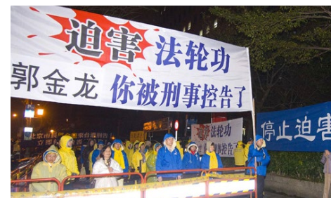
▲ 2012年2月18日晚，法轮功学员在台大体育馆入口处守候北京市长郭金龙一行人，抗议郭金龙等人迫害法轮功。