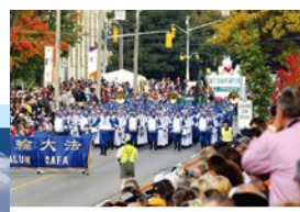
轮功学员罗马集会游行