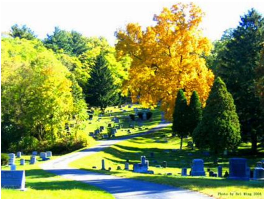
（美国伊萨卡一处墓地，北明摄于 2004 年）

“在沉寂的日子里，你喊叫；在疯狂的日子里，你清醒；你流尽最后一滴血为着亲爱的祖国；你在阴霾中死去，必定在晴空下复活”（林昭狱中血书，引自胡杰《寻找林昭的灵魂》）。