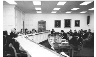
[图：法轮功学员在美国国会听证会上做证词，美国，华盛顿(2000-4-6)]