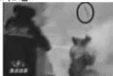
4、重物弹起（软物体不会弹起这么高）。