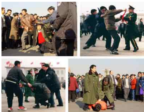
图：法轮功学员在天安门广场和平请愿，遭到警察及便衣的殴打