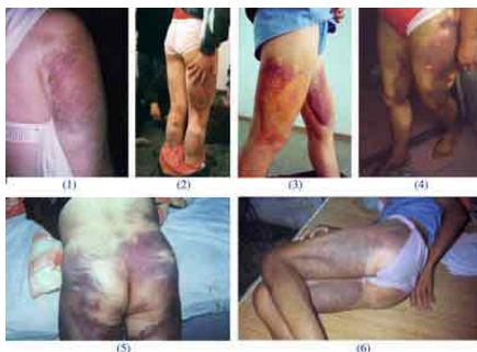
图：被抓被拘的法轮功学员遭到惨无人道的折磨