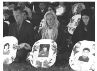
[图：日内瓦人权会议期间法轮功学员烛光悼念被迫害致死的大陆大法弟子]