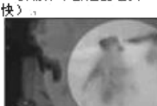
7、第一个镜头中，隐约可