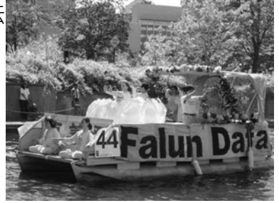
[图：加拿大五月“郁金香节”上法轮功花船]

20 世纪 90 年代，李洪志先生创建的法轮大法在中华大地悄然兴起，以博大精深的法轮佛学理论，揭示了宇宙真理，震撼醒悟世人心尚未泯灭的佛性。法轮大法大道无形，造就了一个与世无争的高洁群体。这是一个具有坚定信仰的理想主义者群体，一个自愿修行者的结合。