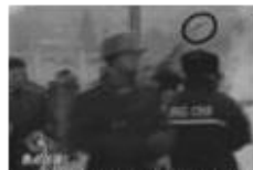
5、重物快速飞入人群中（软物体不会速度这么快）。