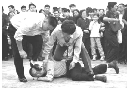
[图：2000年10月，天安门广场。警察手持匕首，踩打请愿的法轮功学员]

这只是许多类似事件中的一例。像上述的殉道者们一样，成千的中国法轮功学员们“承受了难以描述的折磨。”政府官员们使用了包括强奸，注射药物，毒打致残，各种刑具，胶管殴打，严酷的精神和肉体折磨在内的各种方法来摧残他们。