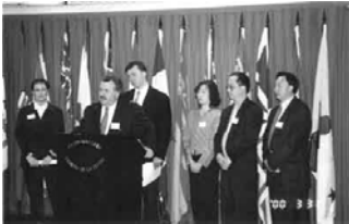
[图：加拿大国会议员鼎承法轮功学员在渥太华国会山举行法轮功记者招待会。加拿大，渥太华国会山(2000-3)]