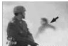
6、镜头随这位军人移回到事发处整个过程不超过 2 秒钟。