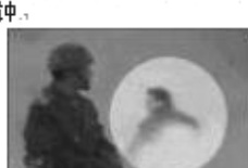
8、最后一个镜头中，可以看到该人仍保持用力姿势。