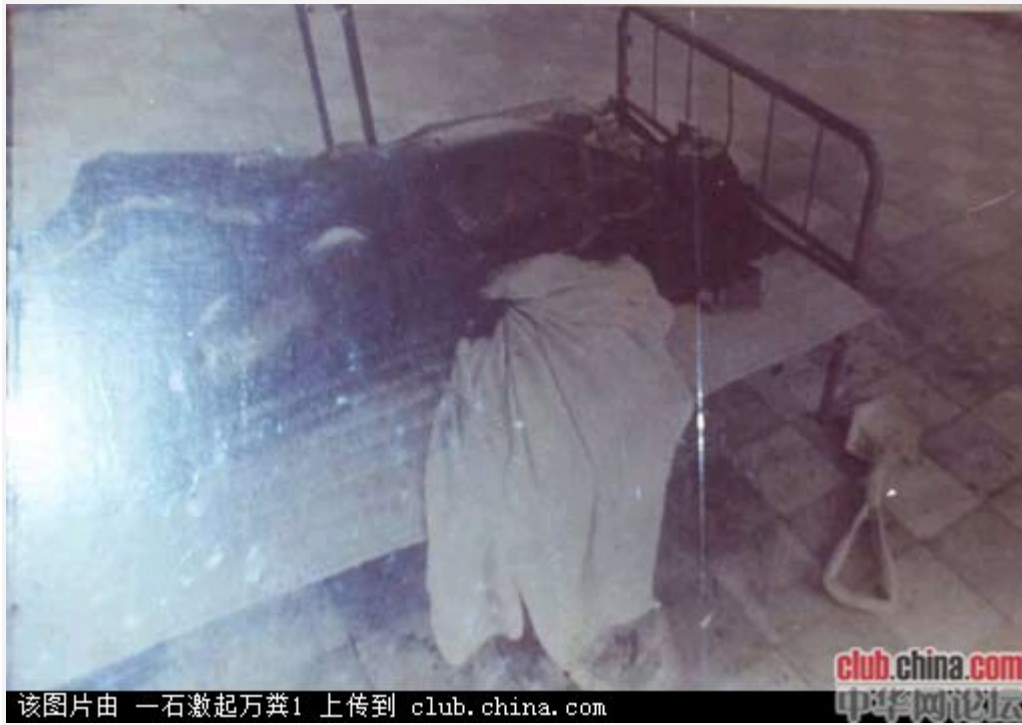
高级囚室里死于酷刑的囚犯