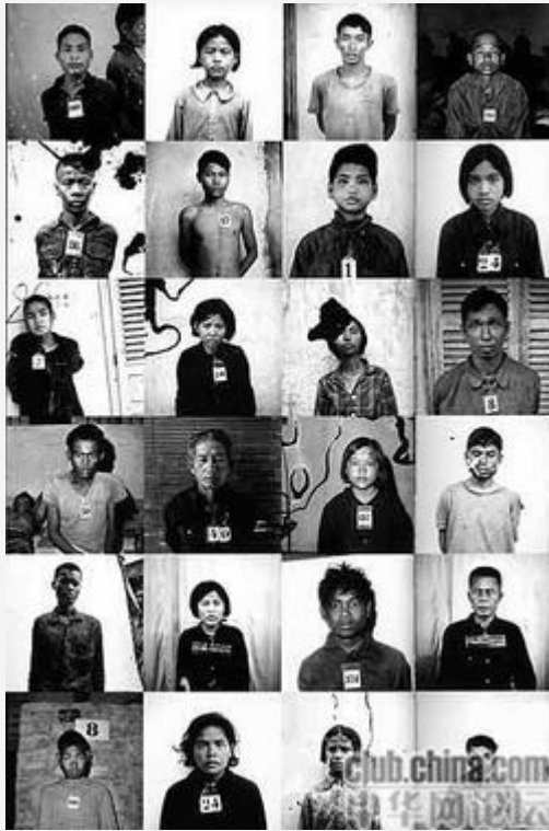
S-21 集中营部分受害者

中，半年内就处决了近 10 万人。而在金边郊外建立的 S-21 集中营，主要用来进行内部清洗。[