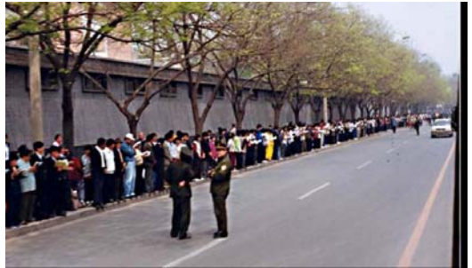
图：1999年4月25日上访现场，法轮功学员文明安静，警察不用维持秩序，在一旁聊天。

其实在“四·二五”上访过程中，法轮功学员平和安静，没有打标语，没有喊口号，对当地的行人和车辆的交通没有造成影响，根本没有什么“围攻”，更没有什么“围攻中南海”，他们只是集体到位于府右街的信访办公室上访，而该办公室在中南海附近。