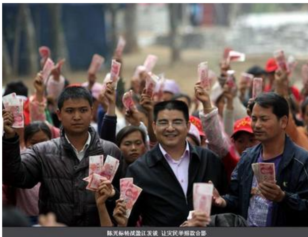
陈光标暴力「慈善」，拿穷苦百姓开涮。

我意识到似乎大家一种共同的情绪被点燃了。大部分人的留言表达了对陈光标由来已久的怀疑和厌烦。