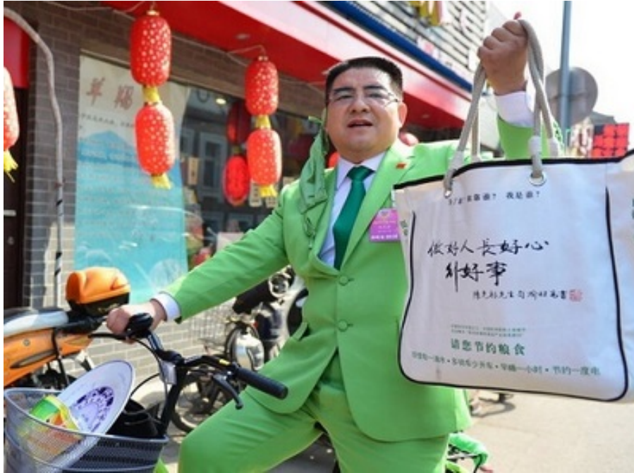
陈光标被逐步揭开伪善的面纱。