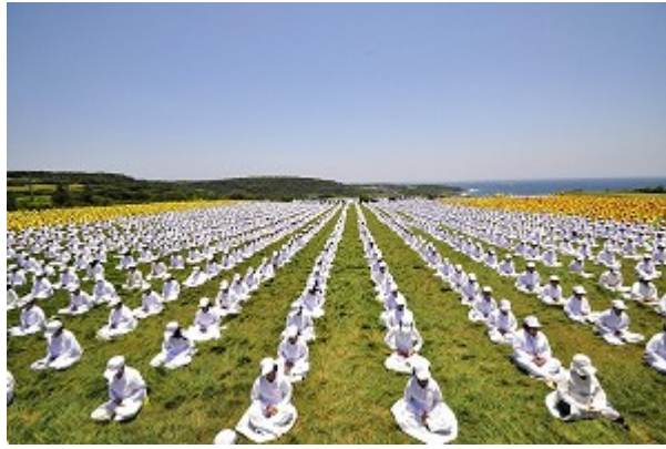
台湾法轮功学员集体炼功

中共媒体一直把法轮功称为邪教。但在中共打压法轮功的十一年里，法轮功却弘传世界一百一十四个国家和地区，并受到了世界各国人民和政府的好评和嘉奖。