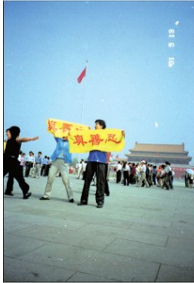
两名法轮功学员在天安门广场打开“真善忍”横幅，和平请愿

对于中共的这项指责，法轮功学员们曾多次强调法轮功的修炼原则金刚不动，任何用法轮功的名义在政治斗争中谋求个人权力和名利等行为，都是与法轮功的修炼原则和修炼目的背道而驰的。因为法轮功作为精神修炼团体，历来对世间的名利不感兴趣。