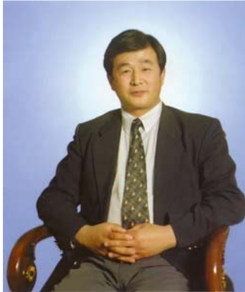
法轮功创始人李洪志大师

据新华社报导，在中国大陆破获了多起所谓的由法轮功研究会操纵指使的盗印法轮功书籍、疯狂敛财的特大案件，并指控法轮功创始人李洪志先生用非法获利的钱在北京等地购买了三套住宅以及奔驰、宝马等名贵轿车等。