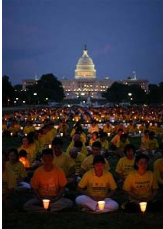
海外法轮功学员请愿

据明慧网报导，法轮功学员在中共打压法轮功后，采取了各种各样的讲清真相活动，其实都是在围绕着说明真善忍的美好、法轮功及学员的正派和无辜、中共的诬陷与迫害、伤害的范围和残酷等等，并希望能够早日终止迫害。