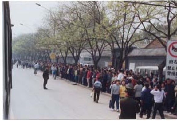
1999年4月25日，逾万法轮功学员北京和平上访

4月23日、24日，天津市公安局动用防暴警察殴打反映情况的法轮功学员，导致有的法轮功学员流血受伤，四十五人被抓捕。当法轮功学员请求放人时，天津市政府放言，中国公安部介入了这个事件，如果没有北京的授权，被逮捕的法轮功学员不会释放。天津公安向法轮功学员建议：“你们去北京吧，去北京才能解决问题。”