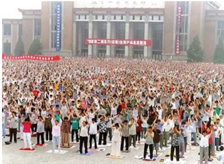
1998 年 5 月沈阳市法轮功学员集体炼功

中央电视台大肆渲染说法轮功不叫有病的人吃药，最终病重死亡，以此为据进一步打击法轮功。事实是如何呢？