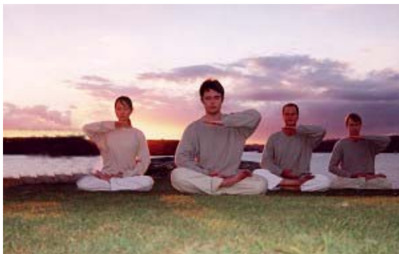
法轮功是由李洪志先生传出的佛家上乘修炼大法

……（法轮功）没有宗教的各种必须遵守的 规定，没有庙、教堂，没有宗教仪式。想学就学，想走就走，没有名册，何“教”之有呢？至于说“邪”，是不是教人向善，不收钱财，为人祛病健身也属于“邪” 的范围呢？或者是，不是共产党理论范畴的就是邪的哪？……其实我非常清楚有的人为何非要反对“法轮功”。就是像媒体报导中说的学“法轮功”的人太多了。一 亿多人是不少，难道还怕好人多吗？不是好人越多越好、坏人越少越好吗？”