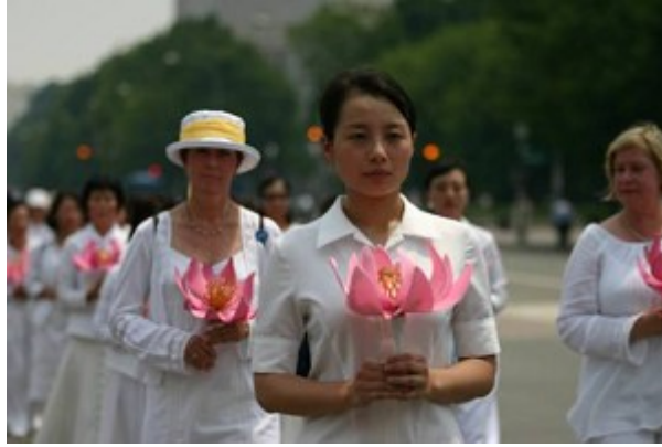
海外法轮功学员请愿

在 海外各国各地、各种场合，法轮功学员使用各种和平方法，利用机缘，持续不断、大面积地讲着真相，其中包括参加庆典游行、社区活动、餐会聚会、应邀表演、参 加展出、演讲解说；文艺创作、纪实画展、舞蹈示范、歌唱演奏；撰文投稿、写书著作、媒体广告、成立网站、拍电视片、编广播稿、参与报纸电视媒体；组织研讨会、学术座谈、校园演讲、烛光夜悼；组织游行请愿、公共集会、新闻发布会、心得交流会、集体大炼功；到各旅游景点、闹市商场、车站机场发传单光盘、征集签 名、解说介绍、免费教功；到中共使领馆请愿陈情；向社区民众、非政府机构、民意代表、各级政府，讲述在中国发生的这场迫害，呼唤良知关注与正义支援。