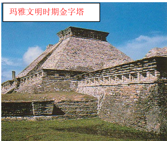
玛雅文明时期金字塔

还有不少石雕和许多谜一样的碑文。也发现了多具人的遗骸。在玛雅文化里有着许多有关人类，生命和宇宙之迷的答案。这些答案很可能就在他们留下的书籍中，有些则铭刻在石碑上和流传在神话里。据考古学家的发掘，玛雅遗迹至少有持续三千年的高度文明。