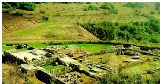
希腊文明遗址之一

古希腊文明 9 起源于公元前 5 千年左右甚至更早时期，其范围在现今希腊与土耳其一带。在经过两次文明的兴衰后在公元前 800 年达到高潮，其文明程度可媲美我们现代文明。从遗留下的遗迹群中，可看出古希腊文明在音乐、美术、文学、哲学、数学、医学、物理、化学等等方面均有极高的水平。