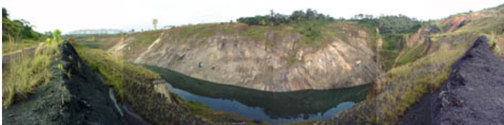
20 亿年前的奥克洛核反应堆遗址

奥克洛 (Oklo) 是非洲加蓬共和国一个铀矿的名字。从这个矿区，法国取得其核计划所需的铀。1972 年，当这个矿区的铀矿石被运到一家法国的气体扩散工厂时，人们发现这些铀矿是被利用过的，其铀含量只有不到 0.3%，低于 0.711% 的自然含量。似乎这些铀矿石早已被一个核反应堆使用过。