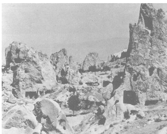
遭古代核战争毁灭的卡巴德奇亚

卡巴德奇亚遗址是一座可容纳数十万人的地下都市，拥有污水处理设备、通风口和炊事场。其生活用具与摩汉乔•达罗文明（0 节）近似。然而从挖掘出的遗址研究，其呈现出曾遭古代核子战争毁灭的景象 9 。