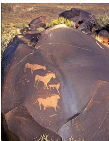
西班牙史前雕刻和绘画

在西班牙北部几个荒无人烟的山洞里，发现了距今 28,000±10,000 年前旧石器时代的雕刻和绘画 21 。考古学家从所在地区的地下发掘出了和画上一致的野兽的骨髓。据考证，这些动物大多为远古时代的珍禽奇兽，有的也早在许多世纪前在欧洲绝迹。