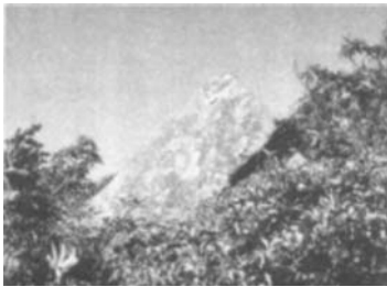
日本五叶山的小金字塔

自 50 年代以来，日本各地陆续发现了大量的金字塔遗迹和巨石建筑，年代相当久远，其中一些金字塔由于表面被灰层和泥土所覆盖，并长满各类植物，外观上看似一座山丘。日本人酒井胜军还发现在远古时代，日本人与犹太人有某种关系。