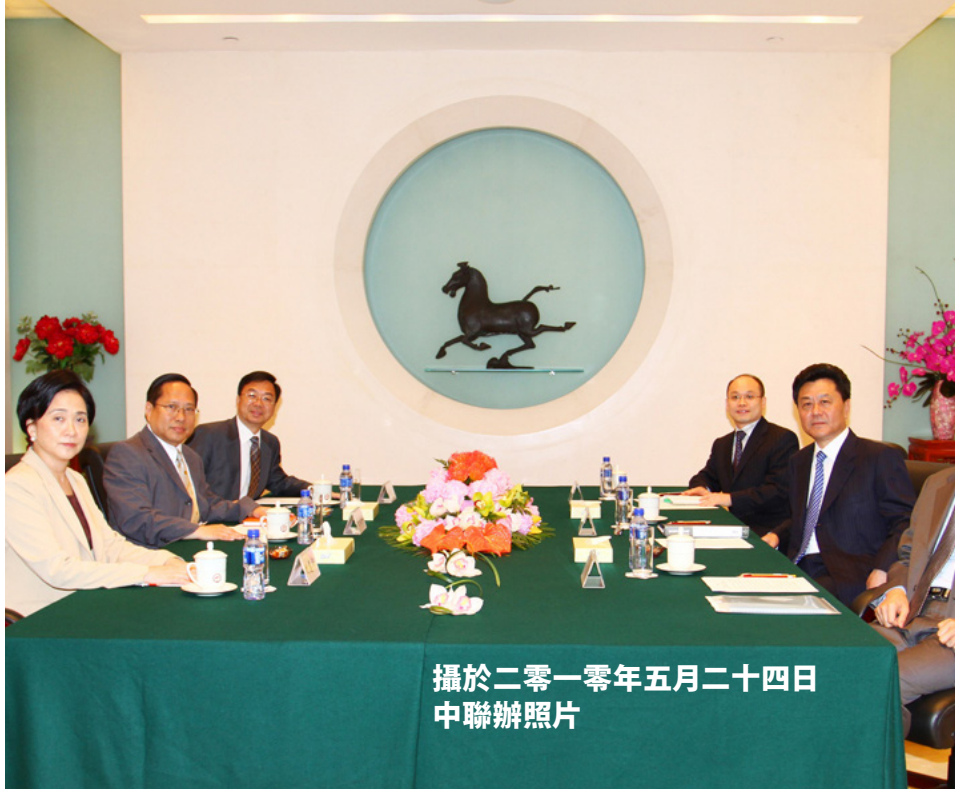
攝於二零一零年五月二十四日