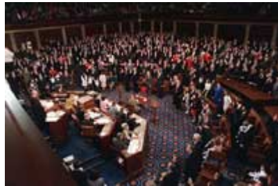
1989 年 1 月众议员在国会山众议院会议厅举行就职宣誓。