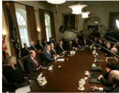
2004 年 11 月布什总统在主持内阁会议。

行政分支的规模远远超过联邦政府的其他两个分支。总统是行政分支的最高领导，任期 4 年。副总统与总统同时当选。一旦总统去世、丧失工作能力或被弹劾定罪而遭到罢免，副总统继任总统。