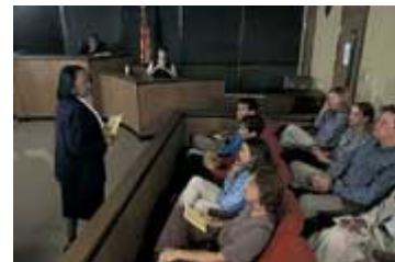
在得克萨斯州一个民事案中，律师在向陪审团作陈述。这是很多法庭上的常见场景。民

另外一个重要区别是，在美国，民选官员的任期固定，只有期满后才需要重新竞选。但在很多议会制国家，执政党可以突然宣布举行选举，也可以因政府被投以不信任票而不得不举行选举。在有些议会制国家，国家元首有权解散议会和宣布重新举行议会选举。