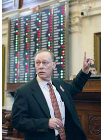
2005 年，得克萨斯州议会一名众议员在全体会议对一项学校金融税务改革提案进行表决时表示投赞成票。在由两院组成的得克萨斯州议会，这项提案随后将被送交州参议院讨论。

最后，由于州宪法要求州政府必须平衡预算，因此，必须将一些例外情况由宪法明确规定出来，如为资助交通运输项目或建筑项目借款等。