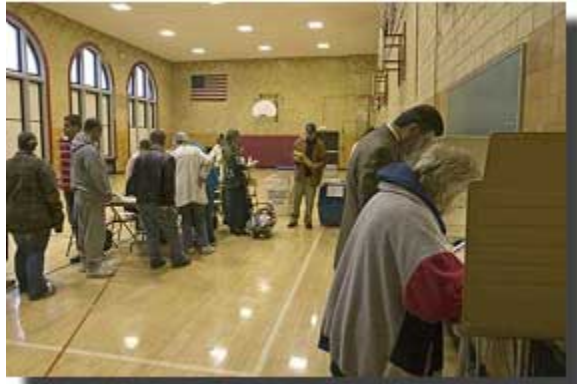
阿拉伯裔美国选民在密歇根州迪尔伯恩一所学校参加 2004 年总统大选投票。

美国的宪政民主共和制并不独特。有很多民主国家采用宪政共和制，并与美国一样有着悠久的民主代表制、法治和宪法保护传统。