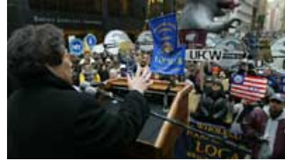
2004年在纽约市，一位工会官员在声援加州食品超市职工罢工活动的工会集会上讲话。

公民个人和私营工商企业为使政府决策人听到自己的声音经常结成联盟或利益团体，但有时候人们也单独采取力争影响政府决策的行动——例如，公民针对某些具体政策问题写信给自己选区的议员或地方报纸的编辑，或者出席有关某项政策的听证会、公共辩论会。