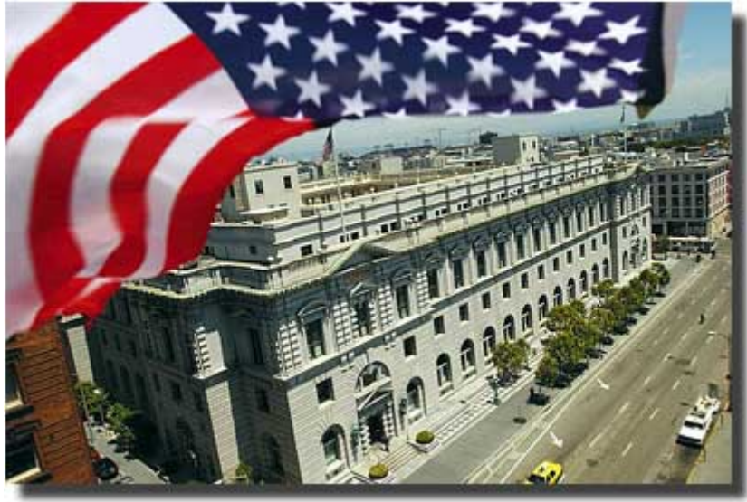
这是加利福尼亚州旧金山的州最高法院所在地。这座建筑内还设有地区法院以及一个联邦上诉法院。联邦法院机构分布在全国各地，形成了除州法和州法院以外的国家司法结构。

作为联邦制国家，美国政府具有多层结构：联邦政府、州政府以及地方政府。《合众国宪法》对国家和州政府都有明文规定。