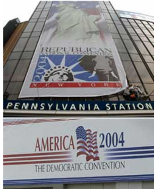
(上)一名工人在纽约麦迪逊广场花园悬挂 2004 年共和党全国代表大会条幅；(下)挂在波士顿弗利特中心 2004 年民主党代表大会会址的横幅

外国政府能够通过其驻美国的使馆展开公关或游说活动，但是外国政府不得向任何联邦职位候选人的竞选活动提供资金。