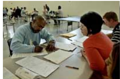
2004 年选举义务工作人员在加利福尼亚州的一个救世军救济所帮助无家可归的人进行选民投票登记。县和城镇政府承担着各种与人们日常生活相关的职责，政府有时得到公民的义务协助。

美国的民选官员有 50 万人以上。其中联邦和州政府官员不到 8500 人，其余是地方官员——市议会议员、地方教育委员会委员、市长、地方治安官以及负责其他职责的官员。