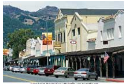
在美国各地，类似位于加利福尼亚州纳帕谷的这个小镇是依靠地方政府管理本地或社区的运作。

自治行政体政府的职能包括各种基本服务，例如：公共安全、街道维修、公园和娱乐设施管理、污水处理、清理垃圾、用地规划及落实建筑规章、救火救急服务、动物管理、公共交通等。较大城市的政府可能还提供住房补贴、经办公立医院、管理由市、州或联邦政府资助的社会福利项目。很多城市还拥有或者负责管理公用事业公司，如水、电、天然气、电信通讯等。