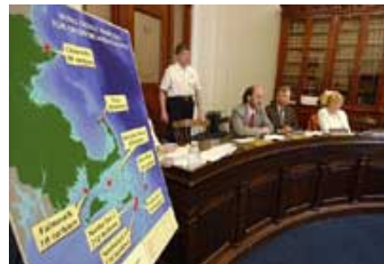
马萨诸塞州议会能源委员会成员 2003 年就一项在近海建造风涡轮电站的提案听取专家意见。