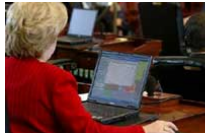
州立法机构与州长的行政机构也呈权力制衡关系。在这张 2003 年的照片中，得克萨斯州议会一位参议员正在通过州参议院电脑查阅资料。