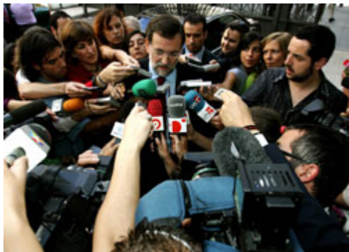
「忠诚反对党」会对政府提出批评与检视，图中为西班牙反对党对媒体发言的画面。

当今多数民主政体采行的内阁制，诉求该制度的快速回应与高度弹性。内阁制政府，特别是透过比例代表制选出的内阁制政府，多朝向多党化发展，即使相对势力较小的政治团体，亦能于立法机关中有代表席次。因此，少数族群仍能参与最高层级的政治决策过程。而包含联合政府的瓦解，最强政党失去人民对它的授权，首相辞职与新政府组成或举行选举 — 都能在相对较短的时间内完成。