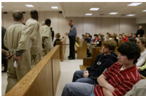
在民主制度下，审判可对大众公开，图中为一群美

人类历史上有很长一段时间，法律都只依循统治者的想法。相反的民主制度则建立起由公民意志所决定的法律。