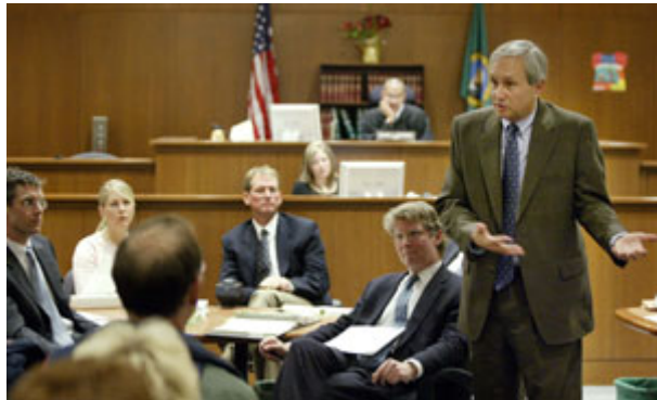
法治是相当复杂的，上图为 2005 年华盛顿州开始审理一项不当解雇员工的诉讼案件状况。

违反法律公平的方式执行权利，也没有经过正式的控告程序。没有任何民主社会能容忍这样的滥权。