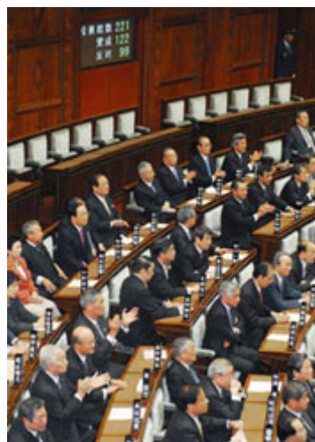
在民主制度中，败选与胜选双方透过议会流程进行政治竞争。