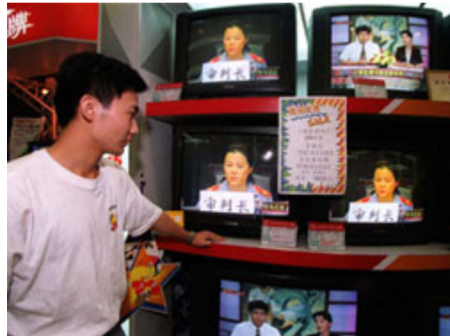
民众可得知司法程序的公开资讯，是资讯自由特色的一部份，图中为中国一名男子正在收看电视播放的审判过程。

政党组织与程序相当繁复。多党的内阁制中，政党多为严密遵守纪律的组织，政党运作几乎都由全职的专业人士负责。而另一种极端的例子就是美国的状况，竞争对手的共和党与民主党都是分权的组织，其功能主要发挥在国会与全国层级决策上 — 每四年逢总统大选时，则会联合起来成为活跃的全国性组织、从事总统大选竞选活动。民主制度中的选举活动是复杂、花费大量时间、有时还有些愚蠢的活动，但选举的功能却相当重要：那就是提供人民和平且公平的方法、选出领导人与决定公共政策。