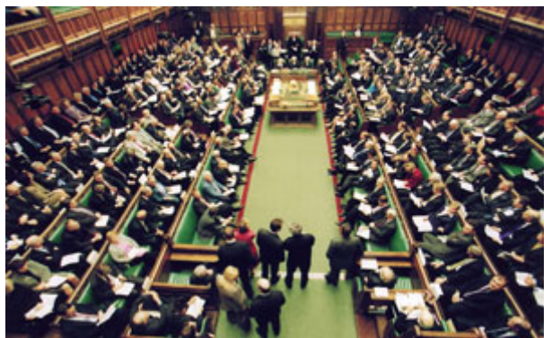
英国国会中的下议院，是全球历史最悠久、也最成功的民主制度体现地点。

在民主国家中，限制行政权的方法有三：一是上述的权力分立，立法、司法机关可以制衡行政机关；二是基本人权由宪法保障，不容行政机关滥权；三是定期举行选举。