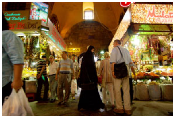
民主发展与经济繁荣通常是相辅相成的：上图为宜斯担堡的一处市场。

人民的言论和集会自由不受伤害。人民可以强力而公开的反对政府官员的行为，但若鼓吹行刺该官员，则是犯罪。