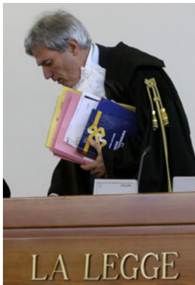
2005 年在罗马法庭内，一名法官结束一项刑事案件的审理，正要离开；法官的服装反应出几世纪以来的法律传统。

内阁制缺乏总统制中分权的特性，因此必须依赖议会本身的内部政治动能，才得以监督及制衡行政部门。这常常造成单一反对党形成「影子内阁」，或造成众多反对党之间的竞争。