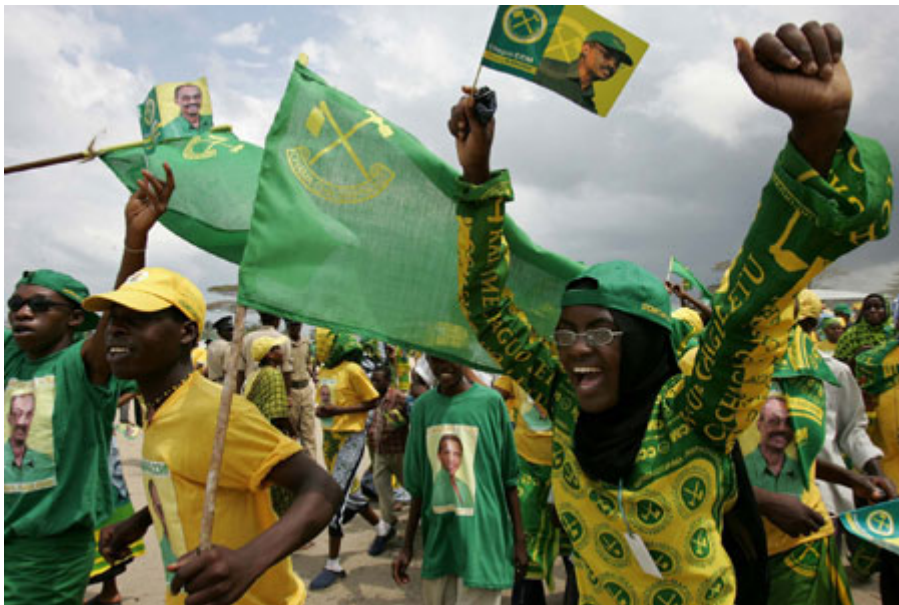
表达的自由也可透过和平集会与示威的型态进行。上图：2005 年桑吉巴的政治集会活动。

媒体的第二项功能是作为政府与其他社会中掌权机关的守门人( watchdog )。新闻媒体只要能把持独立且客观的标准，即使报导未臻完美，仍能揭露政府与公务人员对外声明与言论背后的事实。