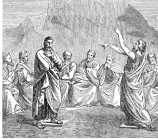
文明的辩论与正当法律程序是民主实践的核心价值，此木刻画作描绘的是雅典最高法院的古希腊形式法庭。

民主（ Democracy ）这个字汇从希腊文的「人民」（ demos ）或「人们」（ people ）衍生而来，是指赋予人民最高权力的政治体制。有些模式的民主由人民直接行使权利，在规模较大的社会中，则由人民选出的代表代为行使权利，或是如美国总统亚伯拉罕林肯（ Abraham Lincoln ）提出的论点，民主就是「民有、民治、民享」的政府。