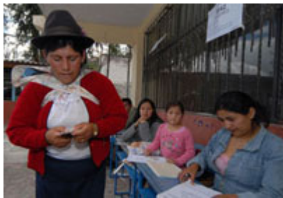
人民针对法律、议题以及政府官员候选人进行投票，这一张 2007 年的照片是厄瓜多尔女性针对宪法改革进行投票动作。