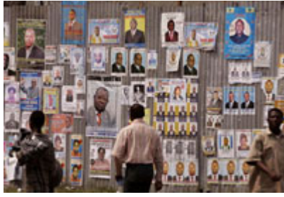
自由选择决策是选举的必要条件，图中是刚果共和国的选民在仔细研究所有候选人资料的情况。

民主选举是定期举行的。民主制度中不应选出独裁者或终身职的总统。被选出的官员必须对民众负责，同时必须在法定的任期后将权利重新交回选民手中，寻求选民授与继续任职的权利，也必须面对可能被汰换的风险。