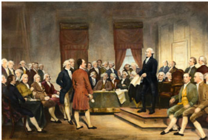
1787 年于费城颁布的美国宪法