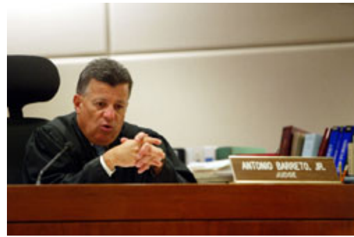
法官的专业是抵抗社会与政治压力的最佳防御工具。

国会议员可针对政府官员的行为与决策提出质疑，核准国家预算，确认法院与部会高级官员的任命。部分民主国家的国会设有委员会，提供立法者一个公开检视