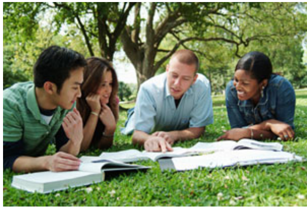
民主建立在相互容忍与合作的基础上。

所有民主体系中，人民都能凭其自由意志透过多数决制订政策。美国评论家怀特（ E.B. White ）曾说：「民主是对于超过半数的人是否有过半的时间都能做出正确决定，提出的周期性质疑」。