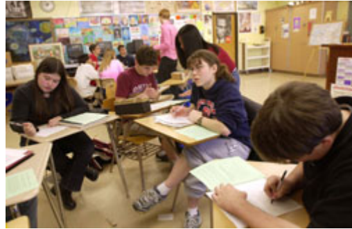
在美国联邦制度下，警政与教育等制度多数由地方层级政府自理财源与管理。

自由的人民可选择其中一种多数人同意的宪政架构，执行方式有很多种。有些民主制度中有单一的政府。另一种方式则为联邦体系的政府 — 政府权利由地方、地区和国家政府共享。