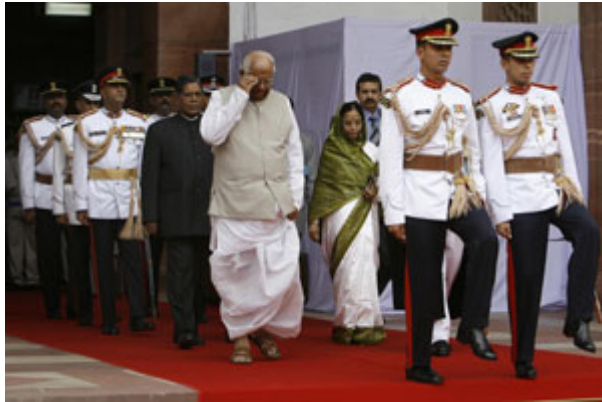
部分民主社会结合了总统制与内阁制的元素。上图为 2007 年印度总统帕蒂尔（Pratibha Patil）抵达就职典礼的状况。

如前所述，透过自由的选举，民主制度下的公民将法律定义的权利授与国家领导人。在宪政民主制度内，政府权利区分为立法单位制订法律，行政单位加以执行，司法单位则以半独立的模式运作。这些部门有时被形容为「权力分立」(separation of powers)，