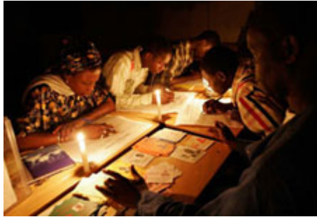
赛内加尔首都达卡市的选务人员，在烛光下计算选票的情形。

民主制度中，选出公务人员的方式有很大差异。以全国性的选举来说，各区选出的立法委员可以是单一代表制，亦即所谓的「赢家通吃」（ winner-take- all ）制。另一种方法则是在比例代表制的系统下，每个政党依据全国总得票数所占的百分比，取得同等比例的代表席次。各省与地方选举也可参照国家选举的模式进行。