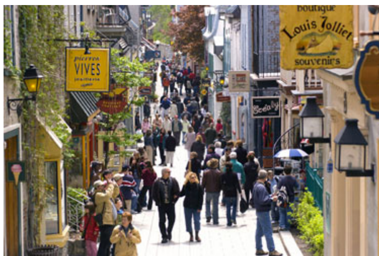
自由让人民能享有平静、私人的个人生活。

自治（Self-government）并不能保证不发生错误、结束种族冲突、保证经济繁荣、或确保人民的快乐生活。但它却让公众能透过辩论找出错误并加以修正，让不同团体有接触机会并解决差异性，让经济有机会成长，并让社会有机会进步、人民有表达意见的机会。