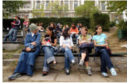
教育能让心灵自世俗中解放，如同图中这些土耳其大学学生一样。

在教育与民主价值之间有直接的连接关系：在民主社会中，教育的内容与执行，能对人民养成民主治理的习惯有所帮助。这种教育的传承过程是民主制度的重要关键，因为有效的民主是动态弹性的、政府的型态取决于公民的独立意志要求。正面的社会与政治改变机会都掌握在人民的手中。政府不应将教育系统视为灌输思想给学生的工具，而应提供教育系统更多资源，帮助他们满足其他人民的基本需求。