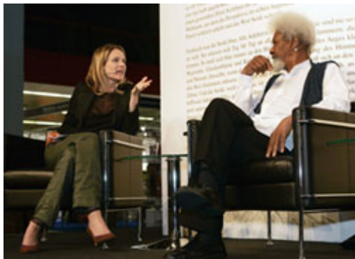
针对任何主题进行公开讨论 — 无论是个人的、文化的、政治的议题皆可 — 这就是民主不可或缺的命脉。上图：奈及利亚的诺贝尔奖得奖者 Wole Soyinka 于瑞士书展中公开言论的图片。