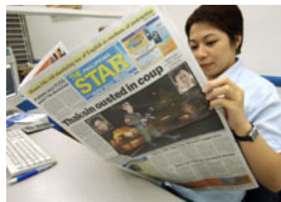
表达意见的自由，需仰赖蓬勃、多样化的媒体与资讯服务。

智的决策，人民需要正确、即时、不受杂讯干扰的资讯。然而另一个媒体的功能也可能是宣传，甚至毫不尝试掩藏其目的性。媒体观众或读者可从多样化、相