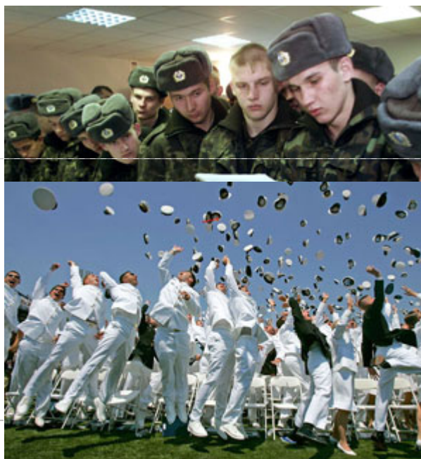
美国军校学生在毕业前将军帽向空中抛去的画面。专业的军人也需要和文人领导者拥有同等教育水准。

民主政体中，防御与威胁国家安全的议题，必须由人民所选出的代表来决定。民主制度中的军队肩负为国家服务的天职，而不是