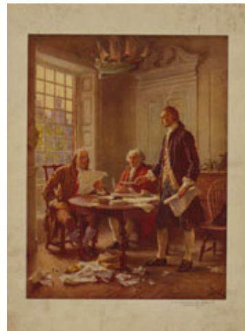
在图中班杰明富兰克林、约翰亚当斯、汤玛斯杰佛逊起草了独立宣言，该宣言的宣告成为美国民主的基础。（Library of Congress, LC-USZC4-9904）

更具体地说、在民主社会中，这些基本或他人不得侵犯的权利，包括了言论和表达意见的自由、信仰宗教的自由、集会自由、以及在法律之前受到平等保护的權利。这并不是民主社会中公民所能享有的所有权利，但却是任何民主政府之所以有资格称为民主，所不可或缺的核心权利。由于他们是独立于政府之外，从杰佛逊的观点来看，这些权利便不得以立法方式剥夺，也不容以选举多数的借口加以侵害。