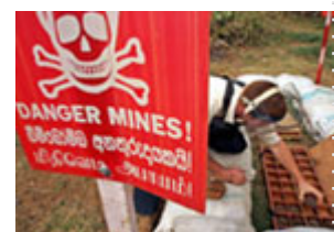
一名英国非政府组织的工作人员，正在斯里兰卡进行移除、保管地雷的工作。