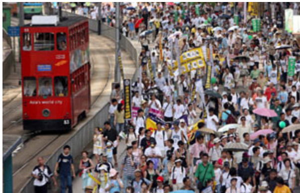
民主就是希望：在 2006 年，有两万名香港人民上街游行，举着标语大喊「正义、公平、民主与希望」。