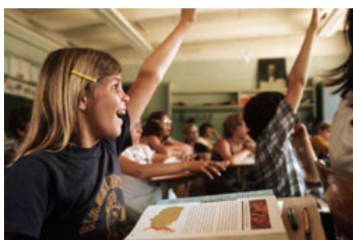
受过教育的公民，才可能成为一个真正自由的公民。(© Ted Spiegel/CORBIS)