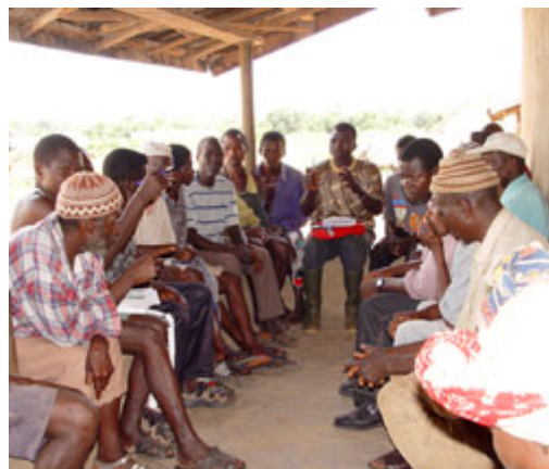
民主制度必然会有冲突与一致的不同状况，在此图中，狮子山国内一群男性正在讨论法律议题。

需求的发言空间，社会将会自内部产生崩解；如果政府施加过多压力企图达成共识，忽视人们的声音，社会则会从上而下被摧毁。