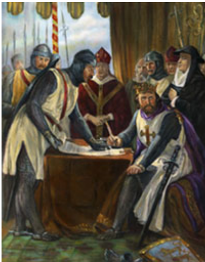
在 1215 年，英国贵族向英王约翰施压，要求签署大宪章（ Magna Carta ），这是英国迈向宪政民主的关键一步，藉由此举英王开始了解自己和所有人一样需受法律约束，并赋予人民法定权利。

自由与民主常被交替着使用，但其实两者并非同义词。民主是自由的完整概念与原则，但也包含历经长时间曲折历史之后，形塑而出的常规与流程。民主就是制度化的自由。