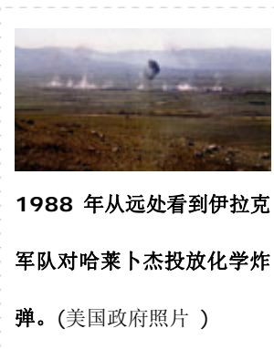
1988 年从远处看到伊拉克军队对哈莱卜杰投放化学炸弹。

这些武器除了有很多可怕的直接后果外，如：造成当场死亡或皮肤和眼睛灼痛，伊拉克政府的档案还显示，它们是被蓄意用来达到已知的长期效果，包括癌症、先天缺陷、神经问题和不孕。鉴于这种武器以单位杀伤人数计算成本低廉，有证据证明，复兴党军队使用不同毒气的混合物，来试验这些武器作为恐怖和战争武器的威力。