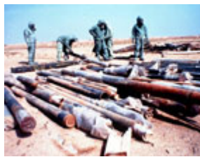
联合国工作人员 90 年代在 密封据说装有沙林神经毒气 的 122 毫米伊拉克火箭。