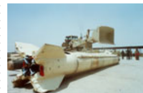
一枚 90 年代待被联合国武器核查人员销毁的伊拉克侯赛因飞毛腿导弹。

前联合国特委会主席理查德德·巴特勒(Richard Butler)在接受一次电视采访时说：