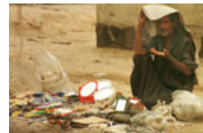
在 1999 年发生反政府暴动的城市巴士拉，一名男子在摆地摊。

用曾经担任联合国伊拉克问题报告专员的马克斯·范德·斯图尔(Max van der Stoel)的话说，巴格达政权是"自二次世界大战以来世界所目睹的最残酷的独裁专制政权。"