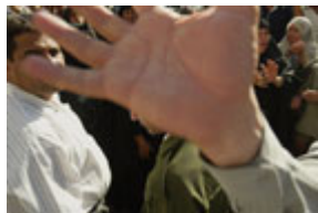
伊拉克官员向一名摄影师示意不要拍摄示威者。示威者在押亲人在萨达姆·侯赛因 10 月 21 日颁布大赦令后下落不明。

根据大赦国际的报告，伊拉克是世界上不明失踪人数最多的国家。但是，当局完全拒绝国际群组织和邻国提出的探寻数以千计人的命运的要求和请求。大多数"失踪人士"是伊拉克北部的库尔德族人，伊拉克南部什叶派社区的失踪人数居第二位。其它少数民族，如亚述人、土库曼人和亚齐德人，也都有长期失踪的人。