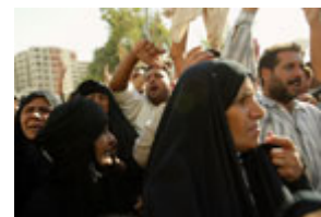
在大赦令颁布后下落不明的伊拉克囚犯的亲人 10 月 22 日在巴格达示威。