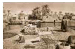
伊拉克沼泽地区的生活在

伊拉克对居住在南部沼泽地区的什叶派社区的迫害，构成人道与环境上的双重暴行。巴格达政权在这些地区实行了将沼泽地抽干，强迫当地居民搬迁的策略。