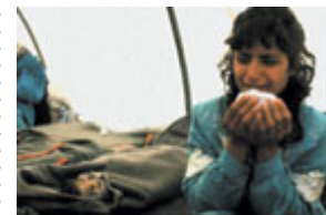
一名少女惊悚地目睹 1988

要知道，这是极其阴险恶毒的。伊拉克人知道毒气比空气重，因此在对这个地区进行几个小时的传统炮火攻击后释放毒气，毒气向地窖和地下室渗透造成的效果会更大。这也就是说，他们知道人们在遭到密集的炮火攻击时总会逃到地下室去。当他们被困在地下室时，（伊拉克人）用化学武器发起攻击.....使地下室实际上变成了毒气室。