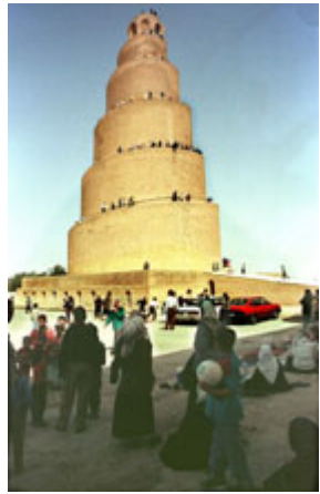
萨迈拉镇(Samarra)大星期五清真寺的大宣礼塔，建于公元 848-852 年

一个新的伊拉克将是联合国、阿拉伯联盟、伊斯兰国家群组织中的一个备受欢迎的伙伴，并且受到渴望看到伊拉克进步的各个发展群组织、人权群组织和公民社会群组织的欢迎。