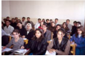
苏莱曼尼亚大学的英文课 (Michael Rubin)

萨利赫自豪地指出，这个地区在 1991 年只有一所大学和 804 所中小学，而今天已经有三所大学和 2700 多所中小学。三所大学 — 苏莱曼尼亚(Sulaymani)大学、萨拉赫丁(Salahuddiah)大学和杜胡克(Dohuk)大学的在校学生总人数超过 15000 人，学生不仅来自库尔德族，而且还包括有土库曼族人、亚述族人以及选择逃离萨达姆压迫的阿拉伯族人。