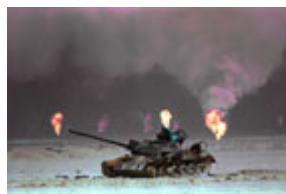
在油井火海旁的一辆被击毁的伊拉克坦克

在国际社会花了几个月的巨大努力将油井大火扑灭后，据专家估计，燃烧的油井向大气层释放出 5000 多吨油烟、100 至 200 万吨二氧化碳、9000 吨二氧化硫、以及未定量的有毒化学物质。土耳其境内出现了黑雨，喜马拉雅山麓降下黑雪。