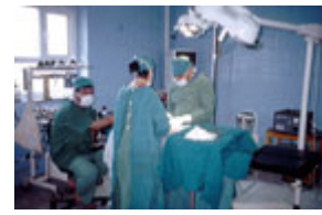
哈莱卜杰的手术室，其设备由石油换粮食计划所得资金购置。(Michael Rubin)

民主原则与实践小群组 2002 年 9 月至 10 月在伦敦郊外开会。派代表参加会议的党派和团体的数目之多及其多样化，显示出这些党派团体致力于民主和多元。它们当中有：伊拉克国民大会(Iraqi National Congress)、伊拉克民族阵线(Iraqi National Front)、伊拉克民族协约(Iraqi National Accord)、库尔德斯坦爱国联盟(Patriotic Union of Kurdistan)、库尔德斯坦民主党(Kurdistan Democratic Party)、君主立宪运动(Constitutional Monarchy Movement)、伊拉克土库曼阵线(Iraqi Turkoman Front)、伊拉克国民运动(Iraqi National Movement)、伊拉克部族联盟(Alliance of Iraqi Tribes)、伊拉克民主论坛(Iraqi Forum for Democracy)、伊拉克民族联盟(Iraqi National Coalition)，还有亚述族的代表。