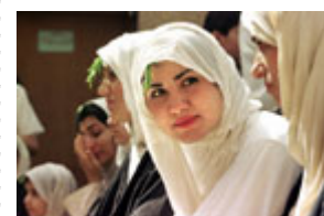
伊拉克曼达派萨比教的女信徒 2000年6月在巴格达接

一位长期观察伊拉克的观察家曾多次说过："只要萨达姆仍然掌权，就不会有什么好动态。"