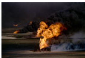
1991 年，被溃逃的伊拉克