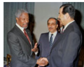
萨达姆·侯赛因与联合国秘书长科菲·安南(左)1998年在巴格达会面，安南在努力化解联合国与伊拉克之间的对峙局面。

最后，在 1998 年 10 月，伊拉克政权停止其与联合国特委会的任何表面形式的合作，迫使检查小群组离开伊拉克。作为对伊拉克的惩罚，美国和英国于 1998 年 12 月发起了代号为"沙漠之狐"的空袭行动，打击可疑的化学和生物武器设施。