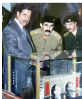
萨达姆·侯赛因查看阿拉伯复兴社会党 2002 年赠送的生日礼物——巴士拉门模