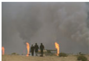
1991 年，三名科威特难民迎着地平在线的熊熊油井大火，从伊拉克边界向家园走去。

根据联合国后来决议的要求，一些被洗劫的物品 — 特别是博物馆收藏品 — 被归还给科威特，国际社会迫使伊拉克用其石油所得的部份收入支付战争赔偿。但是许多珍藏品、博物馆档案和其它被盗物品 — 最痛心的是科威特的公民 — 至今仍下落不明。