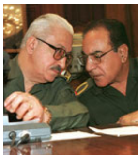
伊拉克副总理塔里克·阿齐兹(左)与外长穆罕默德·赛