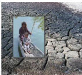
两名伊拉克儿童(内套照片) 1994 年在阿布舒维什沼泽地划独木舟; 背景照片是今日干裂的沼泽地。

1993 年, 沼泽地带聚居着 20 万至 25 万居民, 其中一半以上为沼泽地阿拉伯人, 其它则为境内各种流离失所人员和反对派人士。今天, 几乎所有人都无家可归, 不到 1 万名沼泽地阿拉伯人仍在萨达姆政权有步骤的破坏、摧毁和炮击中度日。成千上万的其它人, 包括妇女和儿童, 遭到伊拉克军队秘密杀害, 伊拉克的又一支独特文化被萨达姆·侯赛因摧毁。