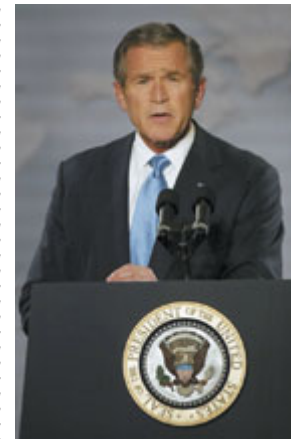
布什总统 2002 年 10 月 7 日指出伊拉克与恐怖主义分子相勾结。

据国际司法联盟 2002 年 9 月公布的有关这些非法收入的最新和最全面的调查估计，自从 1997 年以来，伊拉克通过联合国石油换粮食计划每年合法所得为 60