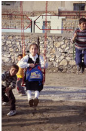
伊拉克北部杜胡克一个普通住宅区的儿童在新的游戏场上玩耍。(Michael Rubin)