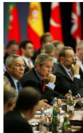
乔治·布什总统(中)、科林·鲍威尔国务卿(左)和欧盟外交政策进阶代表哈维尔·索拉纳 2002 年 11 月 21 日在北约首脑会议开幕式上。