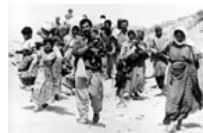
在 1991 年反萨达姆·侯赛因的起义失败后，这家库尔德人被伊拉克军队赶出家园，迁往难民营。

萨达姆·侯赛因在 1979 年的政变中全面掌权，随即便使伊拉克陷入为时八年的两伊战争的灾难和血泊之中；这场战争以僵局的形式告终。萨达姆的这一政治冒险造成 30 多万伊拉克人丧生 — 全部伤亡人数超过 100 万，并且给伊拉克加上了可能超过 600 亿美元的极度债务负担。萨达姆并没有因为在跟伊朗的这场单一目标的战争中的大败而收敛，为了控制海湾石油资源，他再度选择肆无忌惮地消耗伊拉克人民的血汗和财富。 1990 年 8 月，萨达姆入侵科威特并威胁进攻沙特阿拉伯和其它海湾国家。国际联盟在 1991 年的海湾战争中打败了萨达姆的军队，解放了科威特，但是，伊拉克的七个月占领向全世界暴露出这一政权的残暴本质。论其残忍，伊拉克占领科威特期间传出的一系列骇人听闻的讯息与今天人权群组织的报告中所描绘的发生在伊拉克境内的酷刑和杀戮何其相像。一名曾留在科威特抵抗入侵的科威特人将伊拉克安全部队称为"杀人机器"。