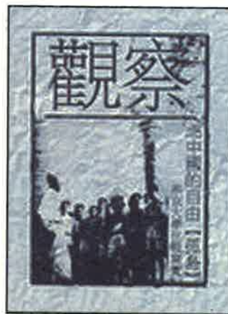
■儲安平1946年創辦的雜誌《觀察》，對共產黨本質已有深刻認識。1950年停刊。