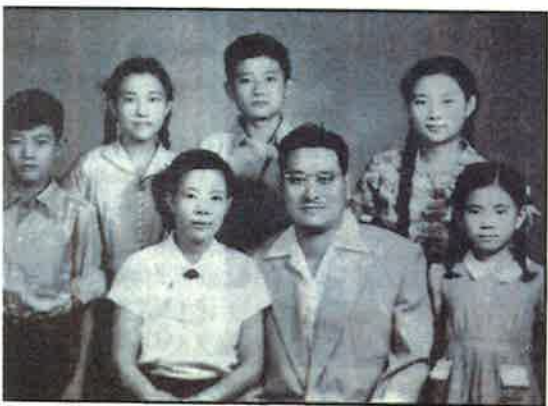
黃萬里(1911—2001)清華大學水利系教授。因為反對蘇聯專家三門峽建壩方案，成為毛點名批判的右派份子，下放務農。1956年黃萬里(前左二)全家合影。