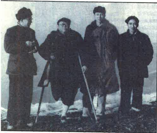
■潘光旦(1899—1967)社會學家。中央民族學院教授、全國政協委員。反右時堅不出聲，仍被定為右派。文革更慘遭批鬥勞改折磨而死。自稱生活是四個S：屈服、投降、活命、死亡。潘光旦是殘疾人，仍不辭勞苦，出外考察。1957年1月在湖北來鳳調查土家族歷史照片。