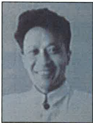
■陳夢家，中國新月派詩人，古文字學家，1957年被打成右派，在文革中受到批鬥毆打，不堪受辱於1969年9月3日自殺身亡。