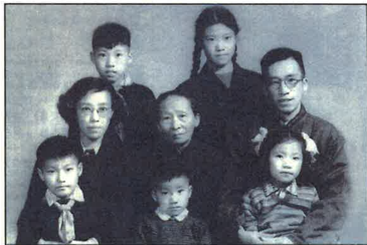
■顧準(1915—1974)一二九運動時期中共老黨員，曾任華東財政部處長，因主張市場經濟劃為右派，1962年摘帽子，調入經濟研究所，1964年批評毛澤東個人迷信，再次戴上右派帽子。死於文革。顧準(中右)與家人。