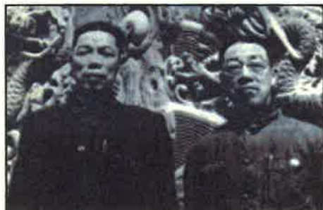
■反右運動對黨政高幹觸動不多。但仍劃了一批省級領導人的右派。浙江省省長沙文漢即是其中之一。沙文漢(左)與其弟。