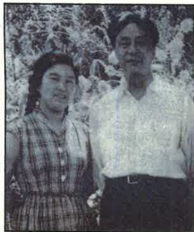
■艾青(1910—1996)中國詩壇泰斗，享有國際聲譽，1957年打成右派後在北大荒新疆勞改。1979年平反復出文壇。艾青與夫人在新疆。