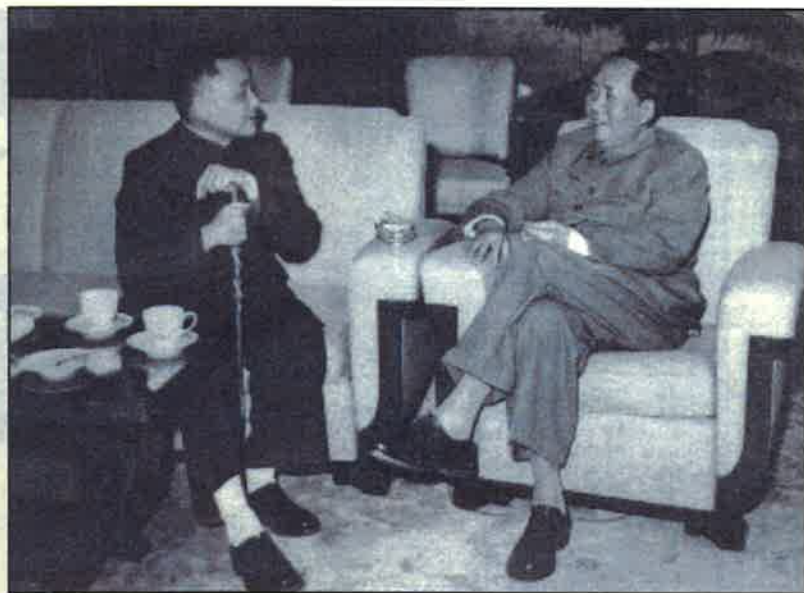
■毛澤東是反右的主謀，並主導與掌控運動的全過程。鄧小平時任中共中央總書記兼反右領導小組組長，是毛反右政策的主要執行者。毛鄧1960年照片。