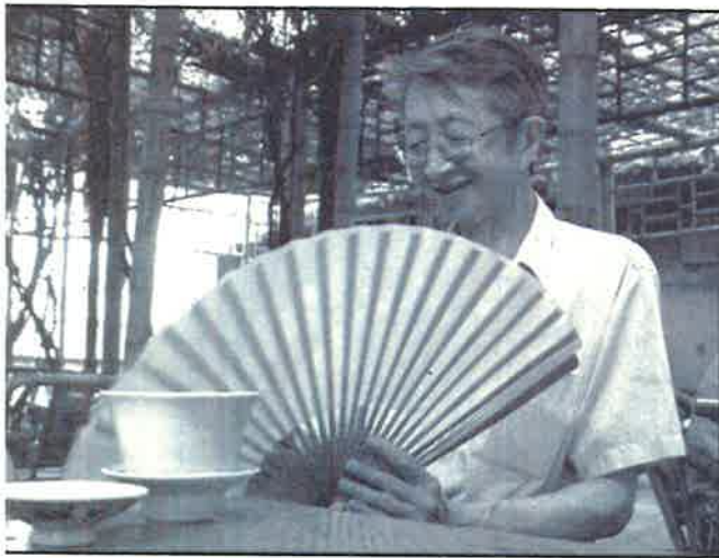
■四川青年詩人流沙河（1931—），1957年創辦詩刊《星星》，發表散文詩《草木篇》，反右中被定為大右派，下鄉勞改。1979年重返文壇。