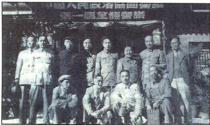
■原國統區文藝界親共名人1949年9月1日首屆全國政協文藝人士合影。後排左起：程硯秋、史東山、田漢、艾青、周揚、丁玲、胡風、巴金；前排左起：趙樹理、馬思聰、蔡楚生、柯仲平。反右運動中艾青、丁玲落網，胡風早已入獄，其餘都未逃過文革大劫。