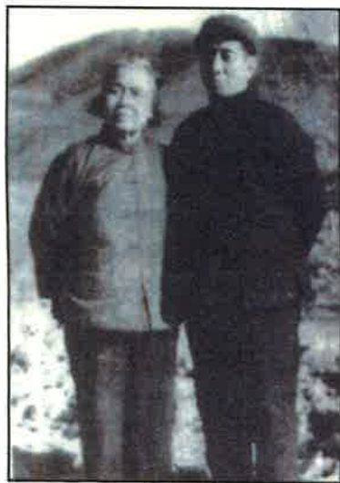
■丁玲(1904—1986)是長期追隨中共的知名女作家，被指為「丁玲馮雪峰右派反黨集團」首領，遭北大荒勞改，文革再入獄。丁玲與丈夫陳明在勞改中留影。