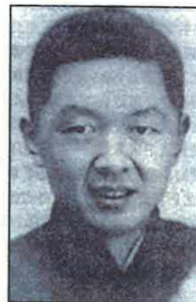
■光明日報總編輯儲安平(1909—1966?)，在鳴放會議上「向毛主席周總理提意見」，批評「黨天下，清一色」。因而被打成大右派。文革初期失蹤。是不予改正的五大右派之一。