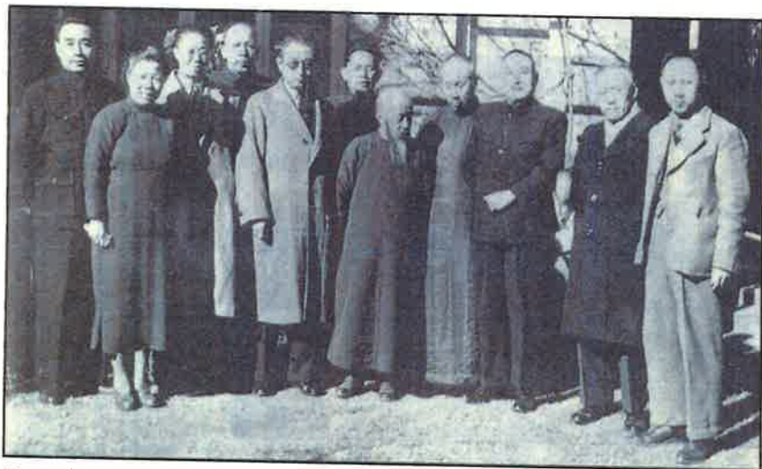
■ 1946年國共和談失敗，共產黨和民盟退出第一次國民大會，11月17日章伯鈞和羅隆基到中共代表團駐地送別。左起周恩來、鄧穎超、羅隆基、李維漢、張申府、章伯鈞、沈鈞儒、董必武、黃炎培、張君勱、王炳南。其中羅隆基、張申府、章伯鈞1957年被定為右派份子。