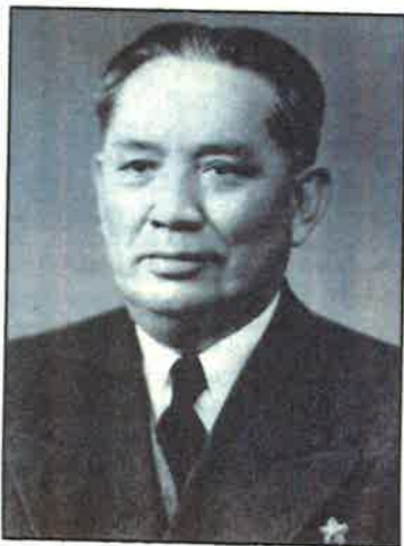
■民盟第一副主席、交通部長章伯鈞(1895—1969)，因提議「政治設計院」，希望中共與各方共商國是，被毛欽點為「章羅同盟」，向黨進攻，又稱為「頭號大右派」。