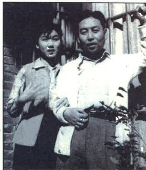
■劇作家吳祖光(1917—2003)曾被周恩來稱為他最好的朋友，但反右中被劃為右派，愛妻新鳳霞(左)堅不離棄，也成為內控右派。吳祖光夫婦攝於五十年代初。