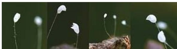
2011 年在美国马里兰州盛开的优昙婆罗花

在东方同样也记载了未来佛弥勒（转轮圣王）下世的另一重大信号。佛经《慧琳音义》卷八载明：“优昙婆罗花为祥瑞灵异之所感，乃天花，为世间所无，若如来下生、金轮王出现世间，以大福德力故，感得此花出现。”