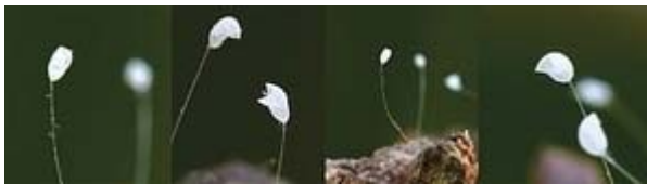
2011 年在美国马里兰州盛开的

在东方同样也记载了未来佛弥勒（转轮圣王）下世的另一重大信号。佛经《慧琳音义》卷八载明：“优昙婆罗花为祥瑞灵异之所感，乃天花，为世间所无，若如来下生、金轮王出现世间，以大福德力故，感得此花出现。”