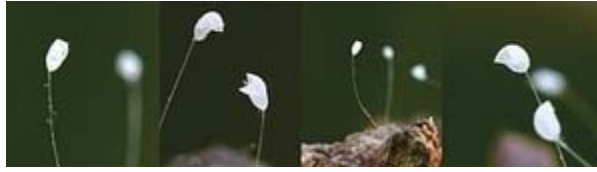
2011 年在美国马里兰州盛开的优昙婆罗花