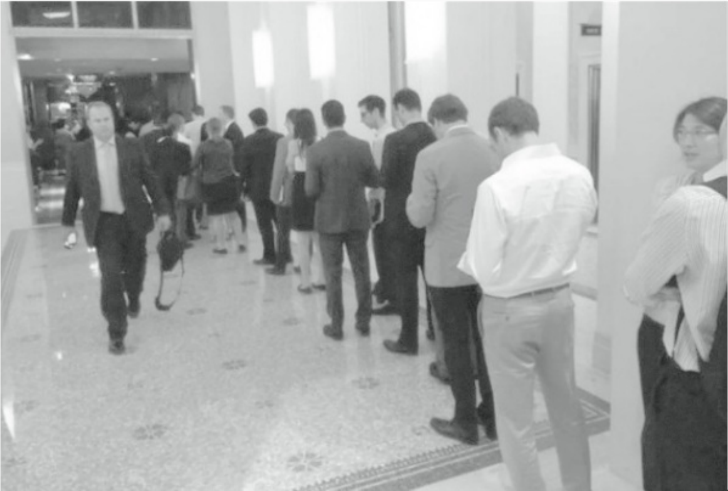
前來參加阿里巴巴IPO路演的投資者在酒店中排起了長隊。

上面提到的那位經理人在分析了阿里巴巴利好的原因後質疑了其經營模式，他認為阿里巴巴公司結構複雜，涉足產業涵蓋了金融、地產和體育等多種門類，這種公司結構很容易出現問題。另外，馬雲作為阿里巴巴的靈魂人物，對公司的影響過大，旁人難以取代——這意味著一旦馬雲個人出現什麼情況，阿里巴巴就會受到極大影響。