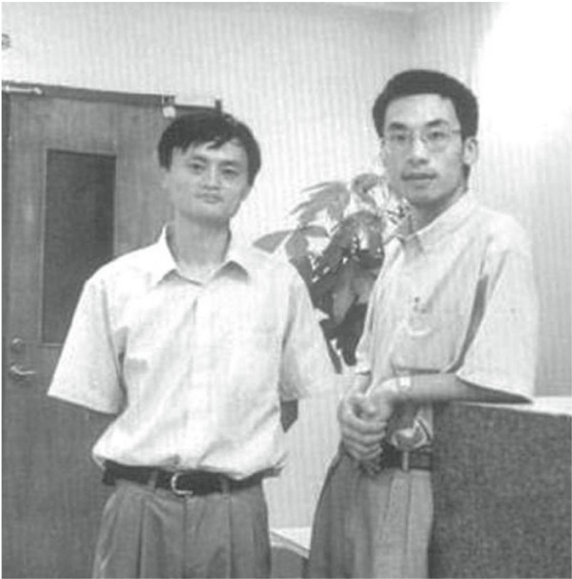
馬雲與中國黃頁的另一位聯合創始人何一兵。