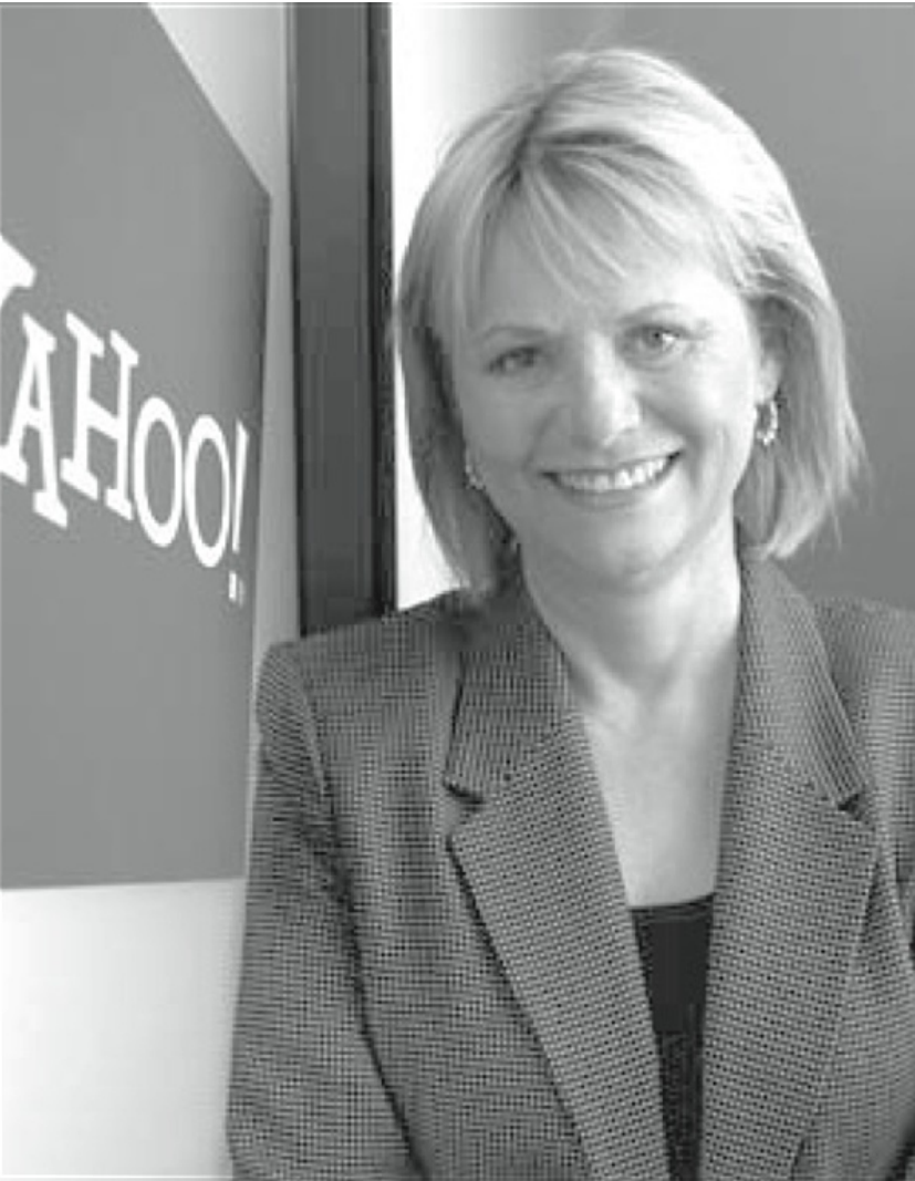
巴茨曾表示有加入阿里巴巴董事會的意向。

2010年，雙方的矛盾已經到了公開化的地步。年初，雅虎發表聲明支持谷歌因不滿中國政府的網絡審查制度而退出大陸地區。對此，阿里巴巴公開指責雅虎在事態尚未明朗的情況下就支持谷歌是“魯莽”行為。