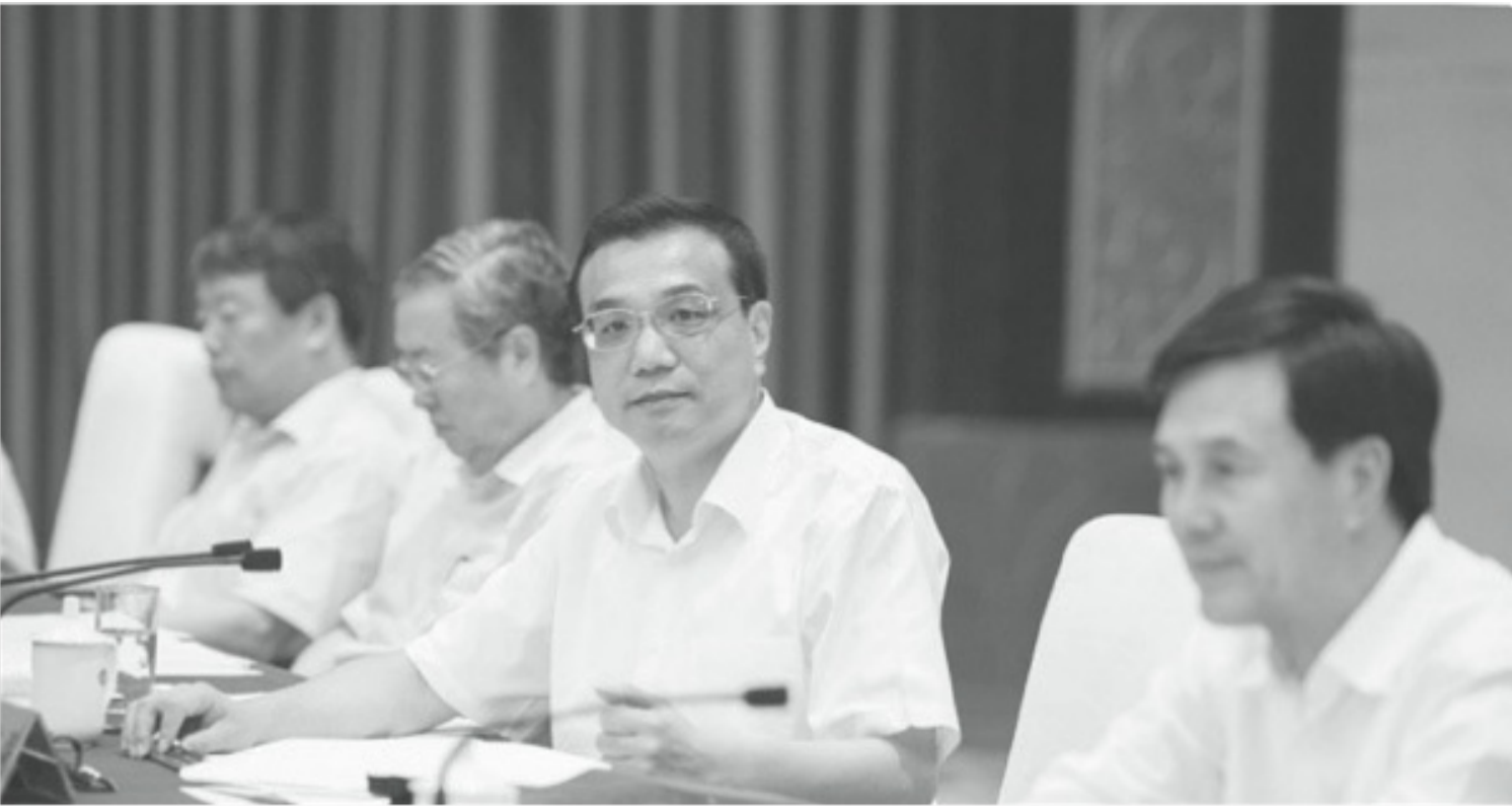
2013年8月李克強在蘭州主持召開促進西部發展和扶貧工作座談會。

值得注意的是，三個月後，新華社於6月5日連續發出三篇逾千字的文章，解釋刺激政策與改革的關係。其中第一篇文章題為《“微刺激”不等於“緩改革”》開篇就指出，去年英國巴克萊集團所創造的“李克強經濟學（Likonomics）”概念，核心是“不刺激、去槓桿化和結構性改革”，但這種概念以偏概全，“造成了刺激和改革對立的輿論假象。”