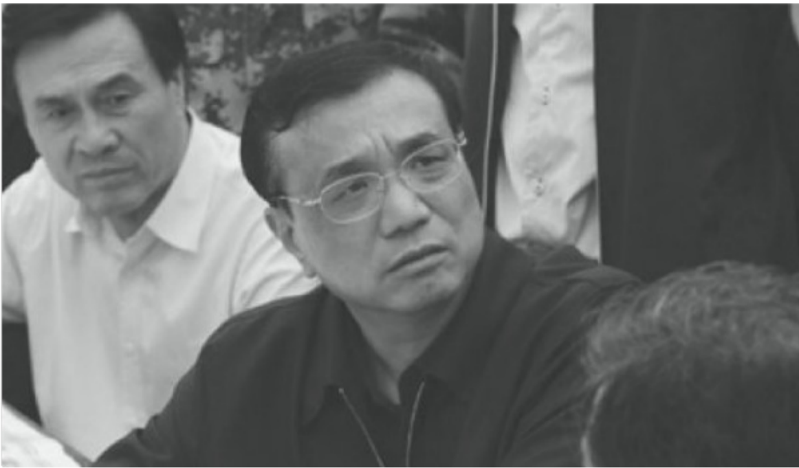
2013年4月李克強在四川雅安市蘆山縣地震災區視察。

“你的這種氣色原因主要有三點所致：一是用腦過度，二是睡眠不足，三是宿便所致。總理，這樣下去不行，身體是為人民服務的本錢！真不知你的保健醫生是幹什麼吃的，是不是國外敵人派來的特務！？ ” 網友“老陳道元” 直言道。