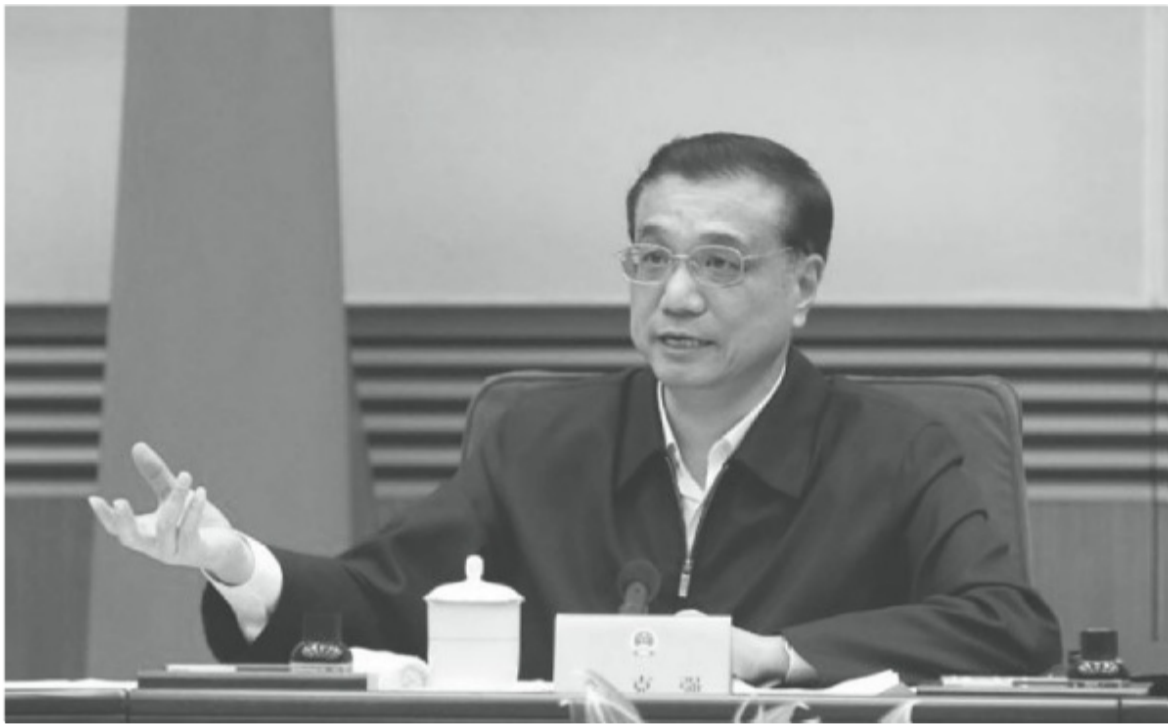
李克強在國務院部門負責同志會議上講話。

也是在2013年與馬雲對話的經濟分析會上，在馬雲介紹了阿里巴巴、淘寶網帶動就業和創業後，李克強接過話頭說：“我也曾有意去瀏覽了這些公司小業主的留言，挺感人的。半夜接到一個單子馬上就送出去，送出後告訴購物方，說能不能給讚一個。說我們創業不容易呀。然後，我看到，對方來了一個回應說你的物品有點兒問題，有點瑕疵。他馬上就說，我立刻給你換。最後又說，我們確實不容易，我們是盡了最大的努力，一定給你換，意思是說你千萬別毀了我的名聲。”