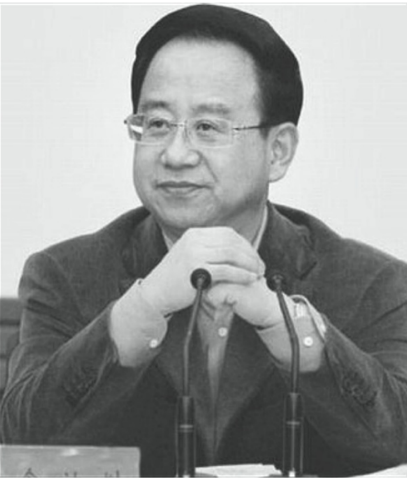
曾經的中南海“大內總管”令計劃。

2006年2月21日下午，原中共中央政治局常委尉健行到北京林河工業開發區入區企業北京現代汽車有限公司及北京第一機床廠視察。陪同尉健行視察的領導有北京市委常委孫政才、北京市政協副主席黃承祥、順義區委書記夏佔義、順義區副區長胡尚雲，以及林河開發區管委會主任張東生等。