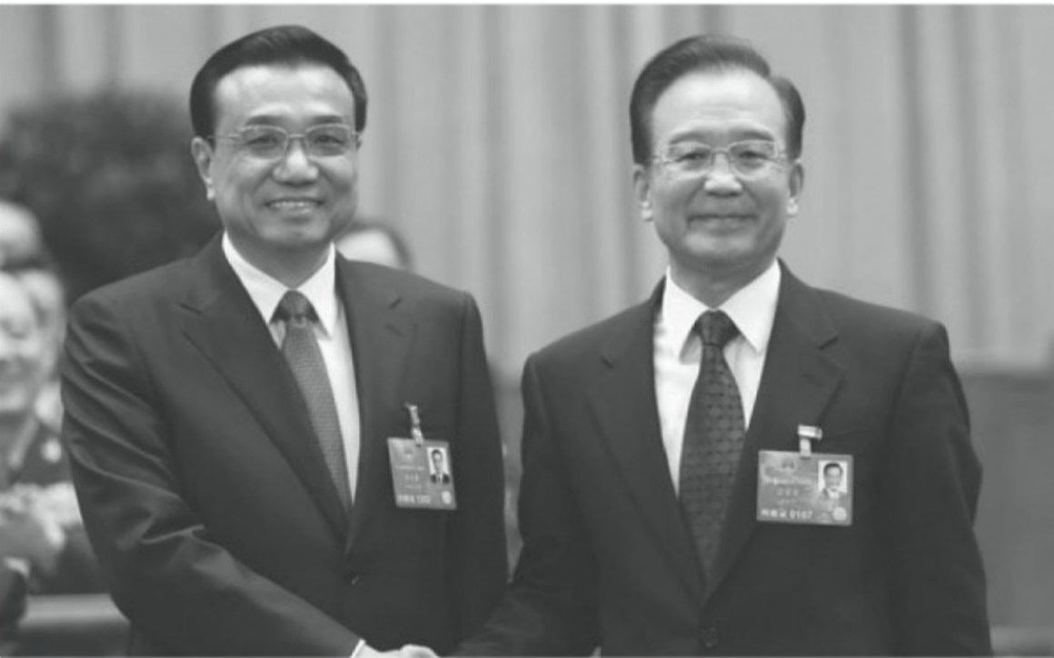
李克強接替溫家寶出任總理。

不過，北京消息來源對《政經》強調指出，除了身體原因，導致李克強在十九大後或許無法連任的另一個主要原因，就是難以勝任。“換句話說，李克強接任總理還不到兩年，但他的個人能力和政治魄力似乎很有限，在掌控經濟方面總是表現出有點力不從心。”消息來源強調稱。