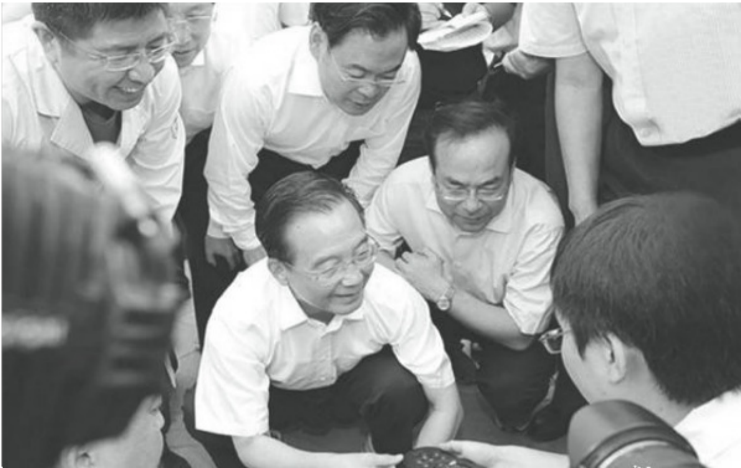
時任吉林省委書記孫政才陪同溫家寶視察災區。

當時中國官方媒體高調報導李克強訪問重慶的消息，並發佈多張重慶市委書記孫政才、重慶市長黃奇帆陪同李克強視察的新聞照片。