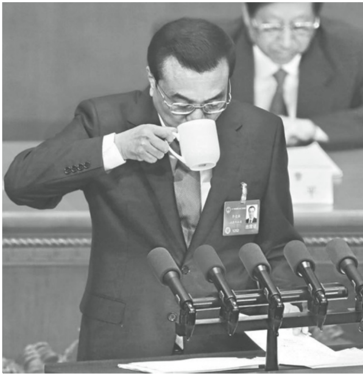
李克強做《政府工作報告》時喝水的鏡頭。

考慮到當時李克強才58歲，這樣的表現倒也還在情理之中。可是如果仔細聆聽其讀報告的節奏，會發現到講話的後半段，他已相當吃力。最開始的20分鐘，李仍然氣定神閒，語句連貫，雖不算鏗鏘有力，但每一句話都會區分重音。但20分鐘以後，李的聲音已明顯沙啞，聲音弱了不少。尤其是最後半個小時，與其說李在讀句子，不如說他在讀單詞：已經不再是完整連貫地表達完一句話，而是一字一頓、一詞一頓。