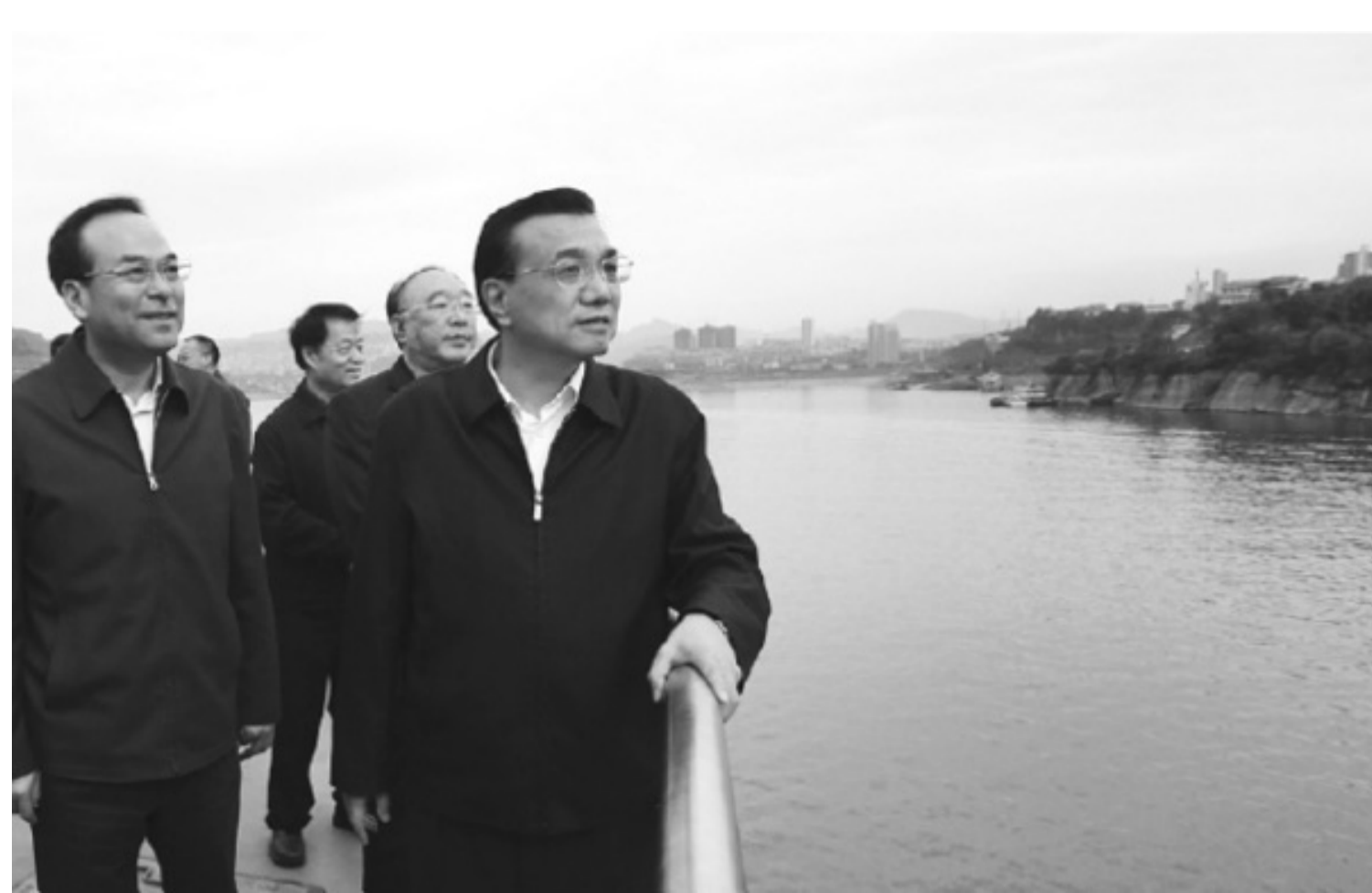
孫政才陪同李克強考察重慶。

中共十八大前夕，有關孫政才和胡春華領銜第六代的說法，曾是西方媒體最感興趣的話題之一。而在明鏡出版社在2012年10月出版的《政治局》一書中，孫政才也名列其中，並引述如下評論：