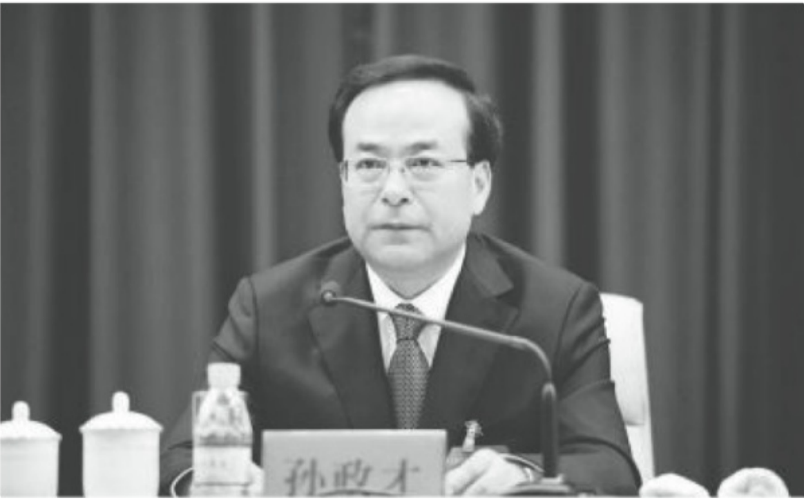
孫政才擔任過吉林省委書記。