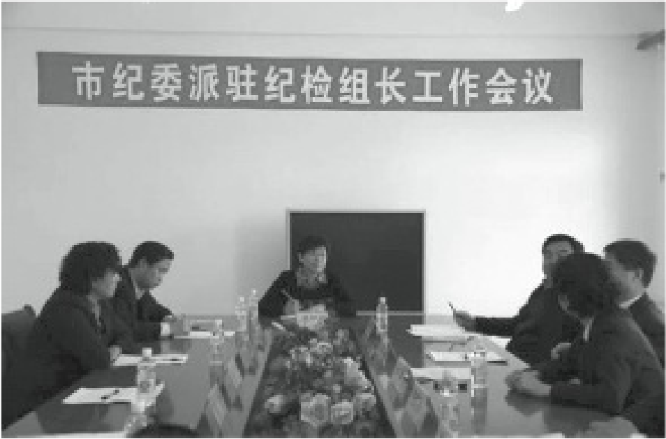
王岐山還有一隻部隊——“紀檢組”。

2013年11月7日，中央紀委監察部網站發布了《中央紀委監察部派駐機構及與其合署辦公的內設機構紀檢組組長（紀委書記）名單》。檢視這份包括51人的名單，中紀委向國家發展和改革委員會、教育部、海關總署、國家體育總局、最高人民法院、人民日報社等44個國務院組成部門、直屬機構及直屬事業單位派駐了紀檢組，一把手稱“組長”，受中紀委直接領導；外交部、公安部、中國人民銀行、國資委、國家海洋局則設立了紀委，一把手稱“書記”；民航局、國家統計局內設黨組紀檢組，一把手稱“組長”，受所在部門黨委／黨組與中央紀委的雙重領導。