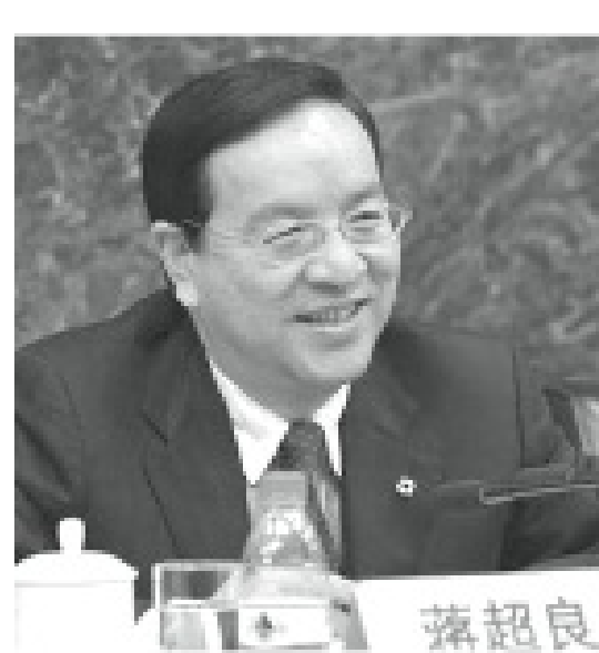
原任農業銀行董事長的蔣 超良, 空降成為吉林省長。

王岐山勢力範圍擴展的一個最為矚目的事件是，公安部副部長劉金國成為紀委副書記。此人擁有長達22年的政法經歷，進入中紀委前，是位列第二的正部級公安部副部長，他用了22年從基層公安機關、到省級政法委再到公安部，在任何意義上都不屬於王岐山舊部，但他的任命卻被認為是王岐山自出任中紀委書記之後，一次相當重要的人事布局，引起的輿論波動最為強烈，由此可見，劉金國對於王岐山的重要性。看來，王岐山的實力範圍真的在擴展，周永康的政法系被打殘後，王岐山如今成了收拾政法系的贏家。