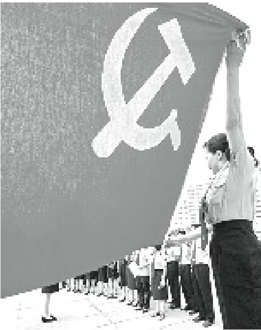
王岐山認為中共最大的敵人 是自己, 因此必須以嚴明的黨紀, 從嚴治黨。