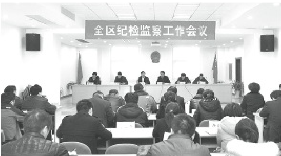
紀檢雙重領導體制開始向中央集權傾斜。

察時局的報導說，多地公開報導顯示，2014年以來，反腐敗協調小組的工作機制經歷了“強權”和“擴容”之後，進一步完善了小組的工作規則，明晰紀檢、法院、檢察、監察、審計等成員單位的職能和責任，細化各部門在重大案件的線索移送、跟蹤督辦、信息通報、案件移交、結果反饋等環節的有效銜接合作，並新增了相應的問責機制。