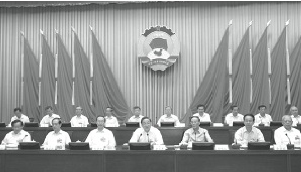
政協會議通常是老套、中規中矩的。

據悉，當天有八位幸運的委員獲得機會。這個過程中，政協和它的常委們還鬧出了一個大笑話。《鳳凰週刊》說，本來委員的每個座位上都設有發言麥克風，但很多政協委員從來沒有使用過，至少在本屆政協幾次常委會上，大家還沒有用過麥克風。不過，在被問及周永康後是否還會有更大老虎落馬時，王岐山一改他的“擲地有聲”，露出了他的滑頭，先是笑而不答，再被問到是不是“你懂的”時，他忽悠說：“以後你就慢慢懂”。