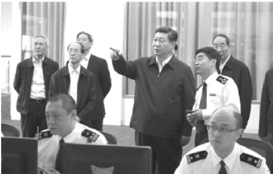
習近平提出“八項規定”、“六項禁令”，盼改變工作作風。

從提出治本治標兩階段論，到政協報告中提出要與政協常委一起探討黨法關係，再到中紀委四中全會治標到治本里程碑性的轉換，王岐山已經形成了他自己反腐與救中共的完整思路。通過治標，為治本贏得時間；治本則推依法治國；而依法治國，則首先要依法治黨，從嚴治黨首要的是嚴明黨紀。王岐山說，中共擁有8600萬黨員，除了自己垮台外，沒有人能打倒。