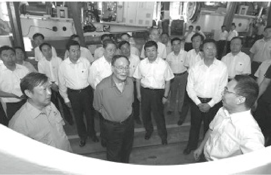
王岐山重視巡視工作，頻率與規模皆為歷來之最。

2014年的兩次巡視並無多少捕獲。3月到5月份的巡視，只有時任天津市公安局長武長順落馬，7月到10月間的巡視，沒有抓到一個老虎級別的貪官，倒是廳局級的腐敗官員抓了無數。