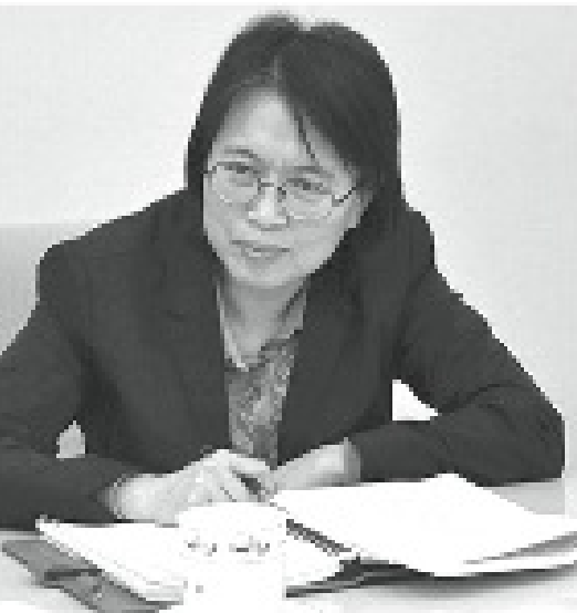
被空投到山西擔任紀委書記的黃曉薇。

不過，在十八屆中央紀律檢查委員會第四次全體會議上，王岐山講話似乎披露出一些矛盾信息。他說，“黨中央橫下一條心，一定要遏制住腐敗蔓延勢頭。在如此高壓態勢下，仍有一些黨員幹部不收手、甚至變本加厲，有些地方甚至出現‘塌方式腐敗’，令人怵目驚心！”。2月前，王岐山說現在“不敢”腐敗已經初見成效，為什麼2月後他又說“變本加厲”、“塌方式腐敗”？這豈是就“不敢”腐敗，而是加倍猖獗腐敗。海外中國政治分析家胡平在《王岐山為何口氣大變？》說，“由此可見，習近平、王岐山打虎受挫，反腐運動虎頭蛇尾。”