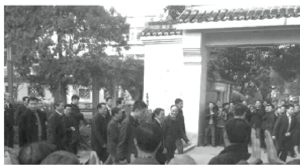
網友拍攝到王岐山現身安徽桐城“六尺巷”。

北京政治舞台現在有兩個超級明星，一個是習近平，另一個是王岐山。現在習近平出場是新聞，王岐山出場是大新聞。就說11月15日王岐山到安徽參觀安六尺巷的事吧，雖然這是王設法低調進行的一次出行，也未被公開報導，但被網友在微博披露後，立即成為新聞熱點，引來無數寫手熱炒解讀。