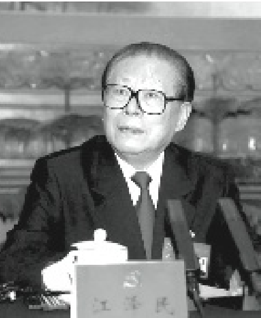
江澤民質問王岐山要搞什麼名堂。

王岐山會不會因為與習近平的關係，而被習近平破例留用，多幹一屆呢？李濤認為，習近平非常倚重王岐山，被越來越黨政軍強勢一把抓的習近平，破例超齡留用一屆中紀委書記(2017-2022年)，這種事情在理論上也有這種可能，但在黨內外利益集團的壓力下，王岐山還是要到齡退休，這是因為習近平和王岐山反腐得罪人太多。這場由習近平主導、王岐山作為副手實施的反腐運動，已經觸及了其他掌權中南海的既得利益群體，而68歲的退休線將成為他們最“理所當然”讓王岐山退休的理由和依據。