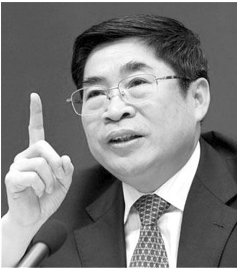
令計劃家族的利益代言人、前山西省委書記袁純清。

據《內幕》雜誌第29期披露，在2012年初，令計劃親自擬定了一份十八大“封官”大名單。在這份被北京官場稱為“令計劃名單”中，令的四大金剛都“榜上有名”，其中江蘇省委書記羅志軍被令計劃和周永康欽點為公安部長，江西省委書記強衛也變成中央政法委書記人選。