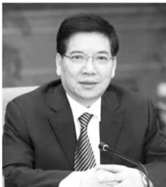
羅志軍在南通市調研。秦光榮

北京消息來源說，與不久前被免職的山西省委袁純清相比，秦光榮的政治問題也非常嚴重，也捲入了令計劃的政變陰謀；與剛倒台的原雲南省委書記白恩培相比，秦光榮在雲南賤賣國有資產和礦山也有過之而無不及，他是令計劃家族在雲南的“帳房先生”。隨著雲南窩案的曝光，涉及到秦光榮的問題很多很嚴重，中紀委是肯定不會放過他的！