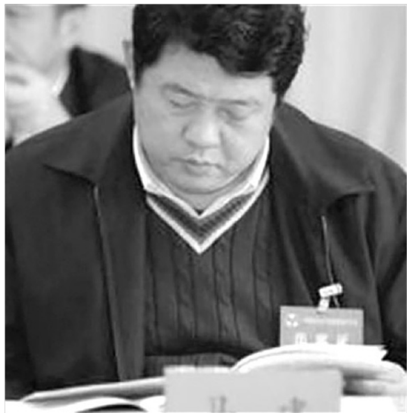
前國安部副部長馬建。

消息人士對《明鏡郵報》說，馬建在國安部的崛起，是由於68屆校友、原國家安全部副部長牛平的栽培；牛平曾任四川省公安廳廳長，是他將馬建挑選進入國安部。