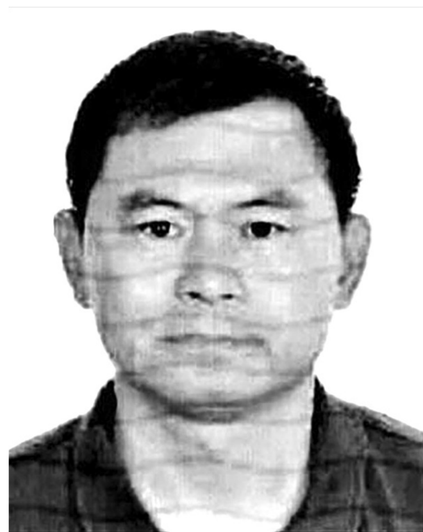
前國安部副部長邱進。

《西政校友》報導出來的消息說，2006年12月4日，西政1980級校友、國家安全部副部長馬建在重慶市國安局局長王勇的陪同下回到母校，看望恩師、學友；正是因為這條消息，媒體在報導時說，馬建最遲於2006年由國家安全部部長助理一職升任國家安全部副部長，躋身副部級。《北京青年報》記者梳理，馬建最後一次公開亮相可以追溯至2014年12月5日和7日，巴基斯坦總統侯賽因、總理謝里夫在伊斯蘭堡分別會見國務委員郭聲琨，當時馬建以國家安全部副部長的身分參加了那次會見。