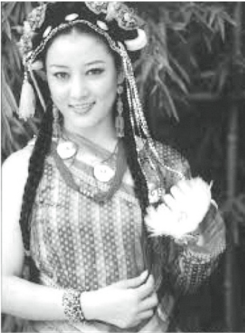
網上流傳據稱是楊吉的照片。