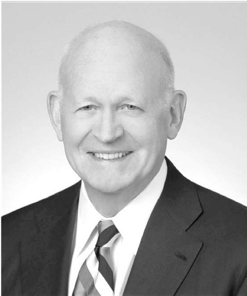
白邦瑞博士（Michael Pillsbury, PhD）

治異議人士；明確表示反對損害美國的競爭行為（如盜竊美國商業和科技機密）；將汙染製造者曝光；揭露貪腐和信息封鎖；支持民主改革派；追蹤並影響中國鷹派和改革派之間的辯論。