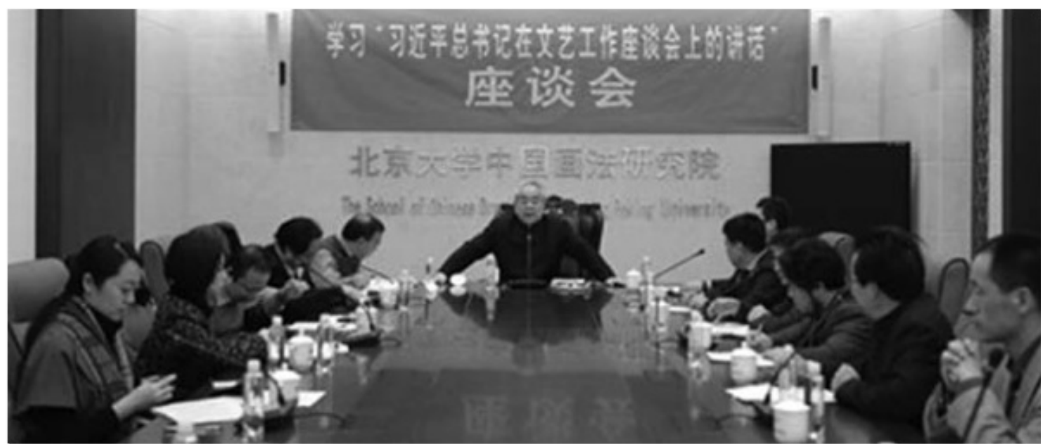
北大“學習‘習近平在文藝座談會上的講話’研討會”。

中國一向以世界的中心自居，彷彿除了自己之外，其餘的國家都是不毛之地、蠻夷之地。而譚寶信偏偏說中國從來不是世界級的強權，這未免太傷害中國人的自尊心了。但譚寶信的論點是有若干論據支撐的。就地域而言，中國的世界影響力向來有限，它的軍隊從未越過裡海東岸，在最盛時期最多不過是一個極大的區域強權。所以，“羅馬和大英帝國是跨大陸強權，而中國不是。”就文化和價值的滲透力，也就是所謂的“軟實力”而言，中國文化影響的範疇，始終沒有超越日本、韓國、越南等周邊的少數國家。今天中國以文化大國自居，但使用中文作為第二語言的人數，卻只有不到兩千萬人，少於英語、法語、俄語、葡萄牙語和阿拉伯語。而真正的世界級的強權，意味著它使用的語言可供其他人學習，以便分享文化、記述或社會權力。譚寶信通過多組數據的分析和比較，戳穿了中國官方公布的2010年學習中文的外國人高達一億的謊言——這是一個跟大躍進中畝產萬斤相似的肥皂泡。