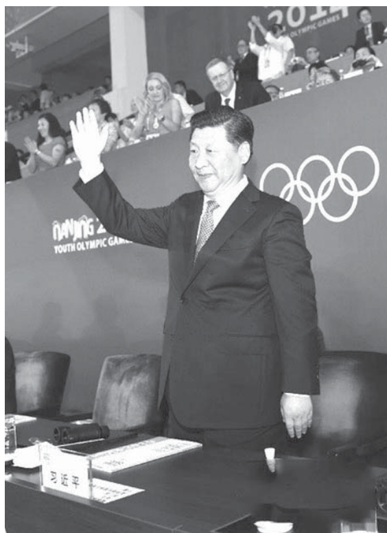
習近平出席青奧會開幕式。