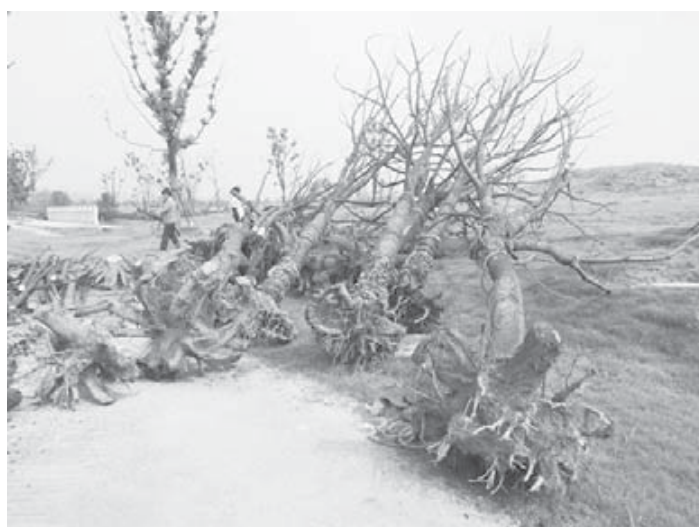
枯死樹木被堆放一起。

該新聞引來網民一片炮轟：“早幹什麼了，你申奧成功時為什麼不種樹非要等到開幕前突擊種樹，面子工程的損失誰埋單，