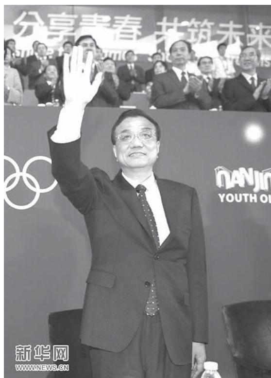
李克強出席青奧會閉幕式。

此次是近年來領導人出席大型運動會開幕式前後，唯一一次沒有在當地安排考察活動。而9月10日，李克強赴天津出席夏季達沃斯論壇，並在中共中央政治局委員、天津市委書記孫春蘭和市長黃興國陪同下，對天津城市發展也進行了考察調研。