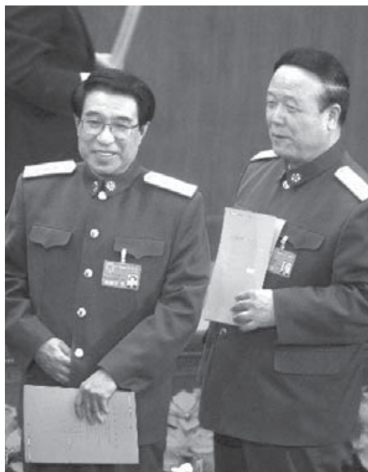
徐才厚已落馬，郭伯雄還能撐多久？

該法辦的法辦，不要像現在這樣，郭、徐黨羽的人還在，官照升，利益鏈一直就沒斷，買官賣官現象依舊存在。有些本身就是大老虎，現在又變成了武松，還在台上查處中老虎、小老虎，你說荒唐不荒唐。明眼人一看就知道，這種查法明顯是糊弄上面，矇混過關，愈查愈叫人沒信心，愈查愈讓人生氣，這也是當前部隊風氣沒有實質性改變的根本原因。