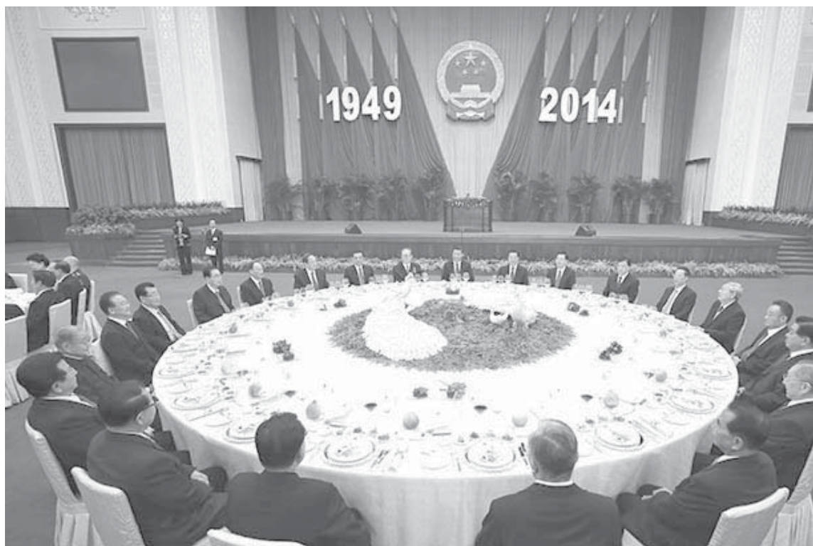
現任、離任中共最高領導人齊聚慶中國國慶 65 周年。

相當不自然——這當然不全是因為 2014 年招待會的飯菜質量明顯不如往年，更多的是幾家歡樂幾家愁，心神不安所至。