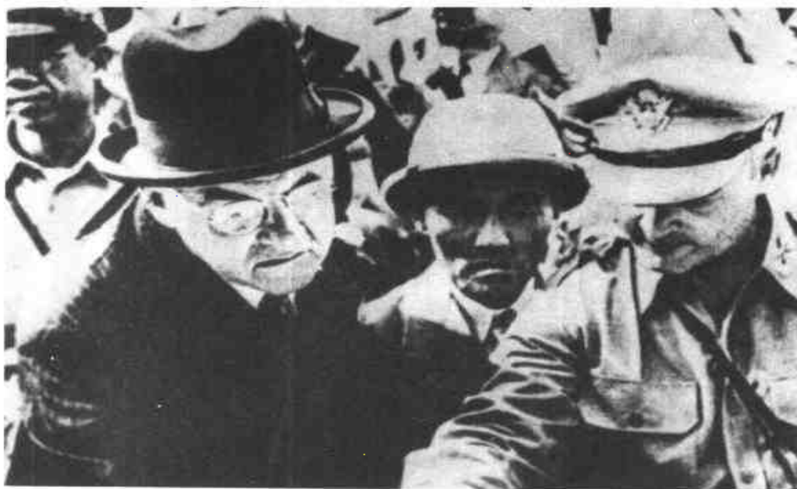
戰爭爆發前夕，杜勒斯（右三）與南韓國防部長申性模（右二）、美軍顧問團團長羅伯茨准將（右一）前往三八線視察。