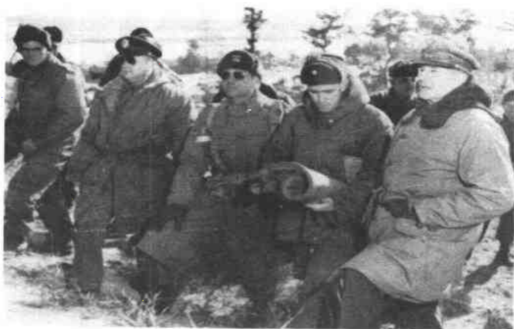
麥克阿瑟（右一）、李奇微（右三）和惠特尼（右四）等美軍高級將領視察前線。