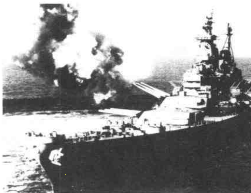
1950年9月15日・美國海軍陸戰隊第一師在仁川登陸一舉成功。