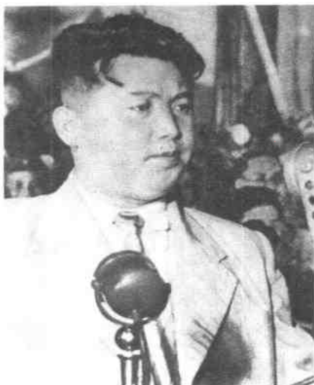
1950年7月8日・金日成發表廣播演說，號召朝鮮人民展開民族解放運動。