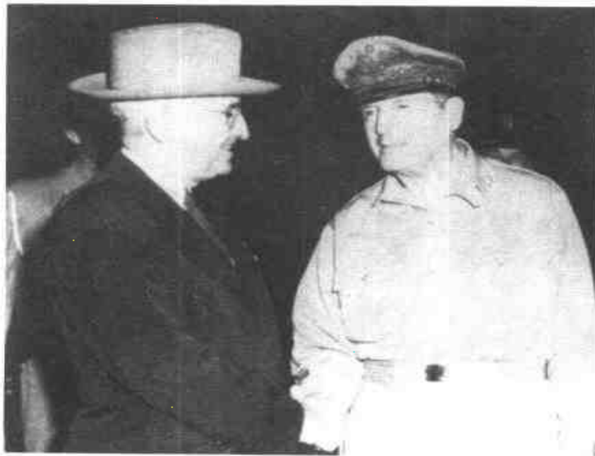
美軍越過三八線後，杜魯門在威克島會晤麥克阿瑟，商討下一步行動。