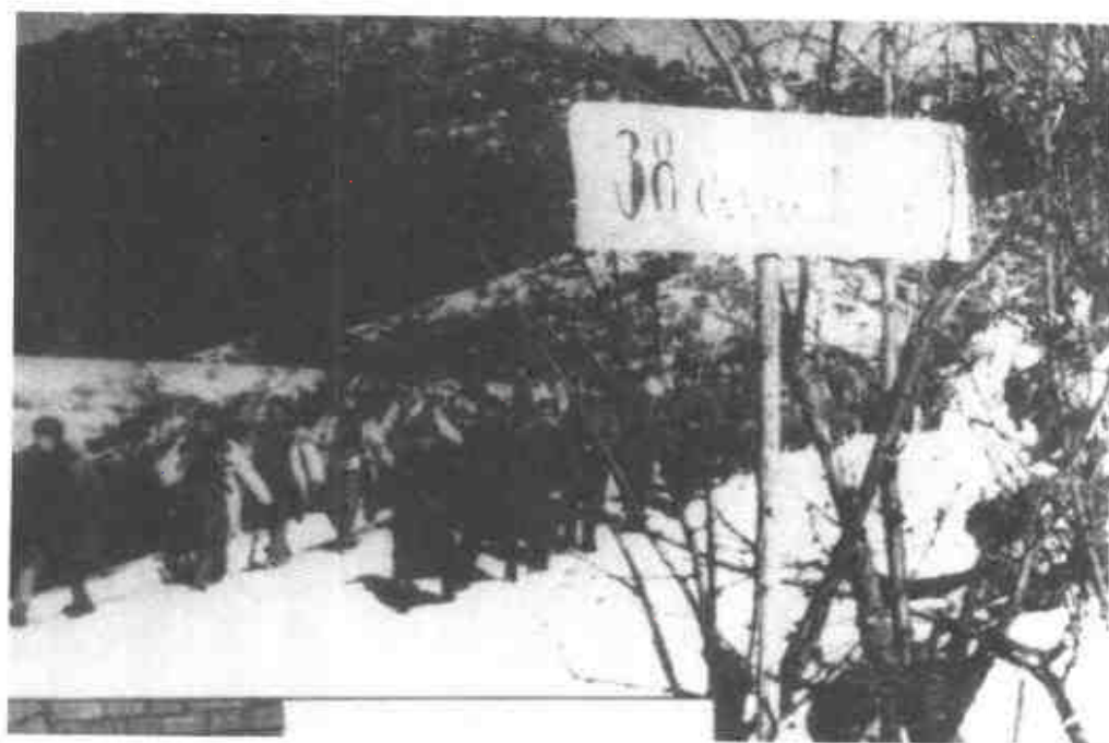
中國人民志願軍與朝鮮人民軍後續部隊一起越過三八線。