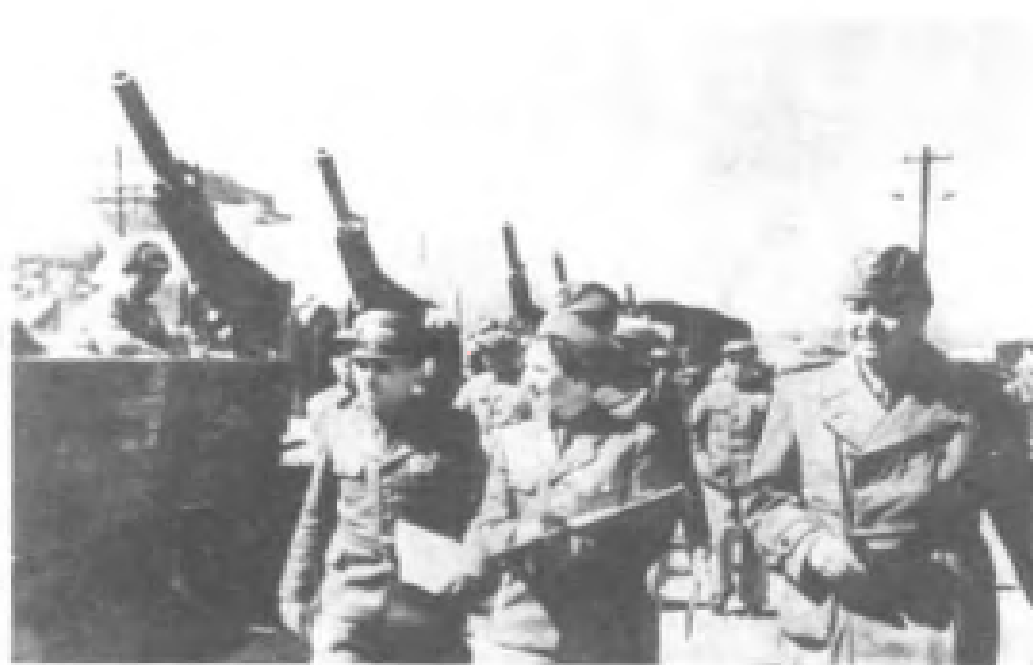
蘇軍代表向中國人民志願軍移交軍事援助裝備。