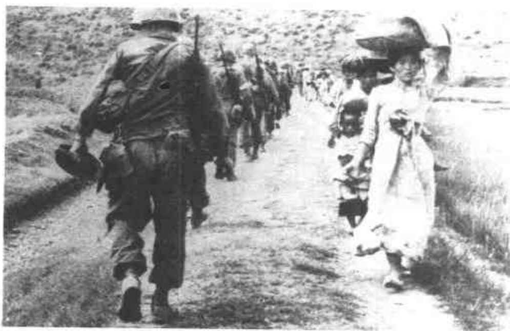
美國捲入戰爭後，先遣部隊迎著南逃的韓國婦女和兒童北進。