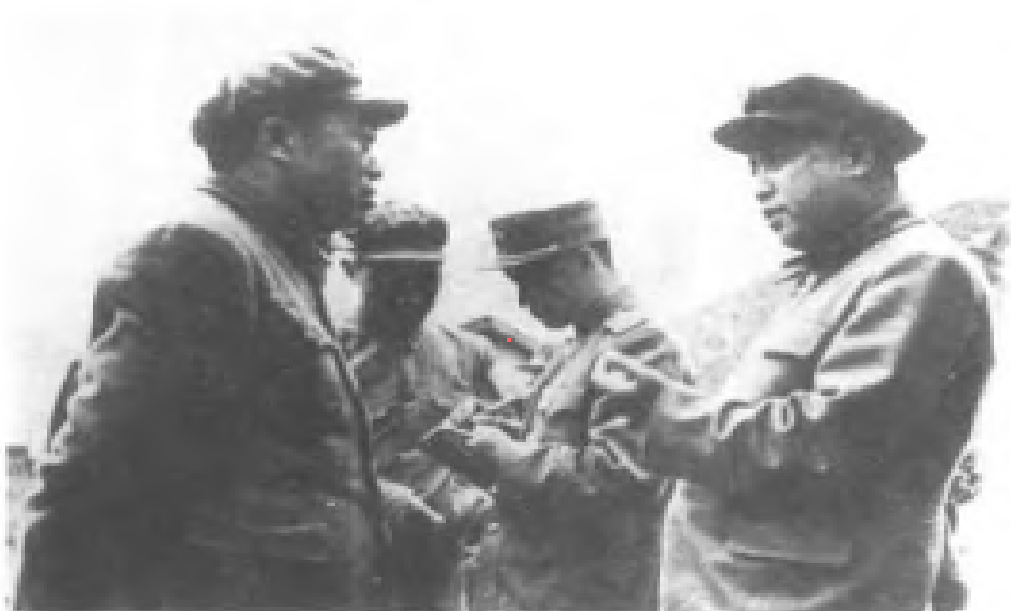
中國人民志願軍赴朝作戰，彭德懷與金日成在朝鮮戰場。