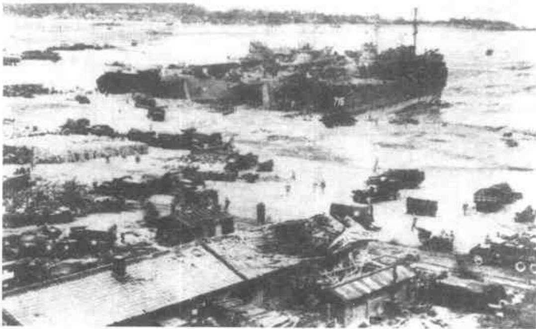
仁川登陸後，美國軍艦密蘇里號炮擊距西伯利亞邊境29英里的清津。