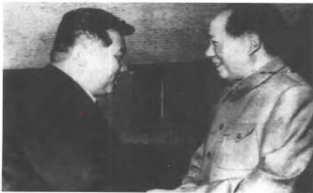
1951年6月初金日成訪問北京，與毛澤東就朝鮮戰爭問題進行商談。