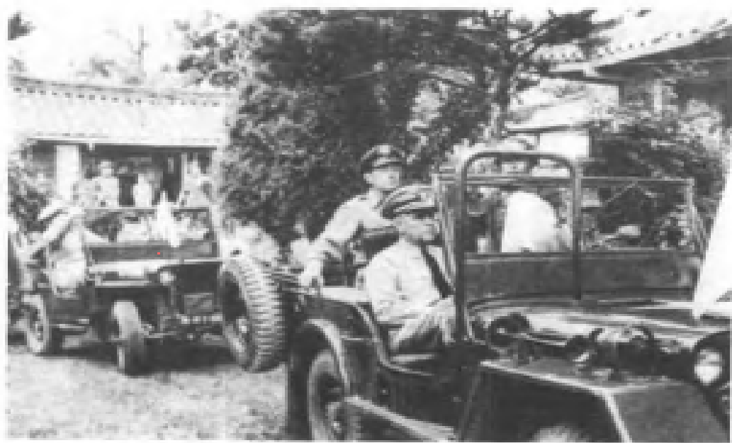
參加停戰談判的美軍代表。