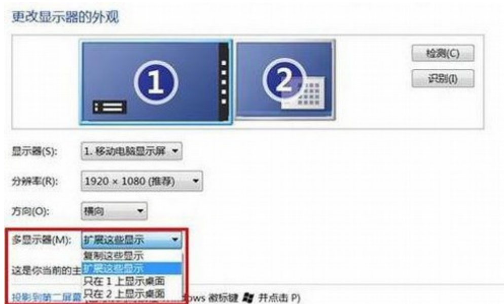
插图 7: Windows 8 屏幕分辨率设置窗口