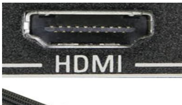
插图 3: HDMI 接口

大家可以在电脑和电视上寻找是否有 HDMI 接口，一般接口附近也会有“HDMI”的字样。有的电视会有超过一个的 HDMI 接口。HDMI 电缆如下图所示：