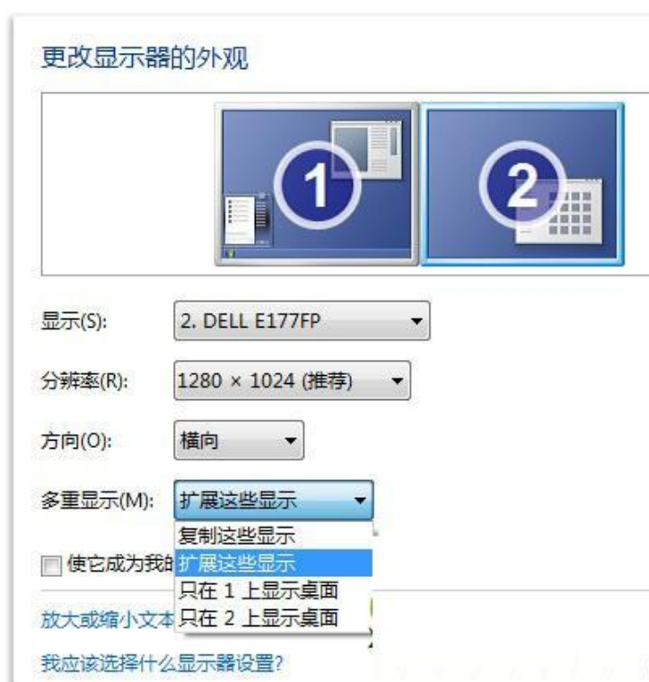
插图 6: Windows 7 的屏幕分辨率设置窗口

如果连接电视的电缆连接正常，就可以发现在“屏幕分辨率”窗口下有一个“多显示器”或“多重显示”的下拉菜单，如下图：