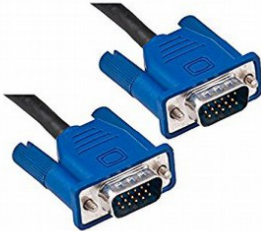
插图 2: VGA 连接电缆

要连接电脑和电视上的 VGA 接口，就需要有两头都是 VGA 插头的连接电缆，如下图所示：