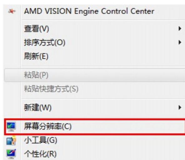
插图 5: 右键并选择“屏幕分辨率”

在电脑上设置电视为外接显示器比较简单。对于 Windows 7 或者 8 的用户来说，在桌面上点击鼠标右键，然后选择“屏幕分辨率”，就可以打开设置外接显示器的窗口。如下图：