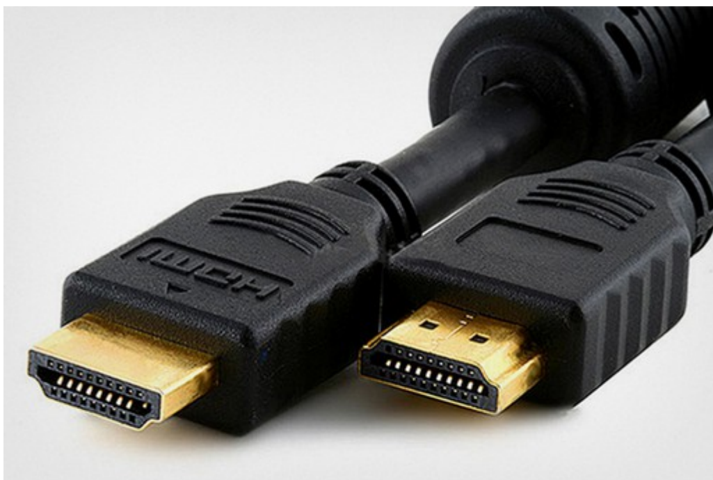
插图 4: HDMI 连接电缆

大家可以在电脑和电视上寻找是否有 HDMI 接口，一般接口附近也会有“HDMI”的字样。有的电视会有超过一个的 HDMI 接口。HDMI 电缆如下图所示：