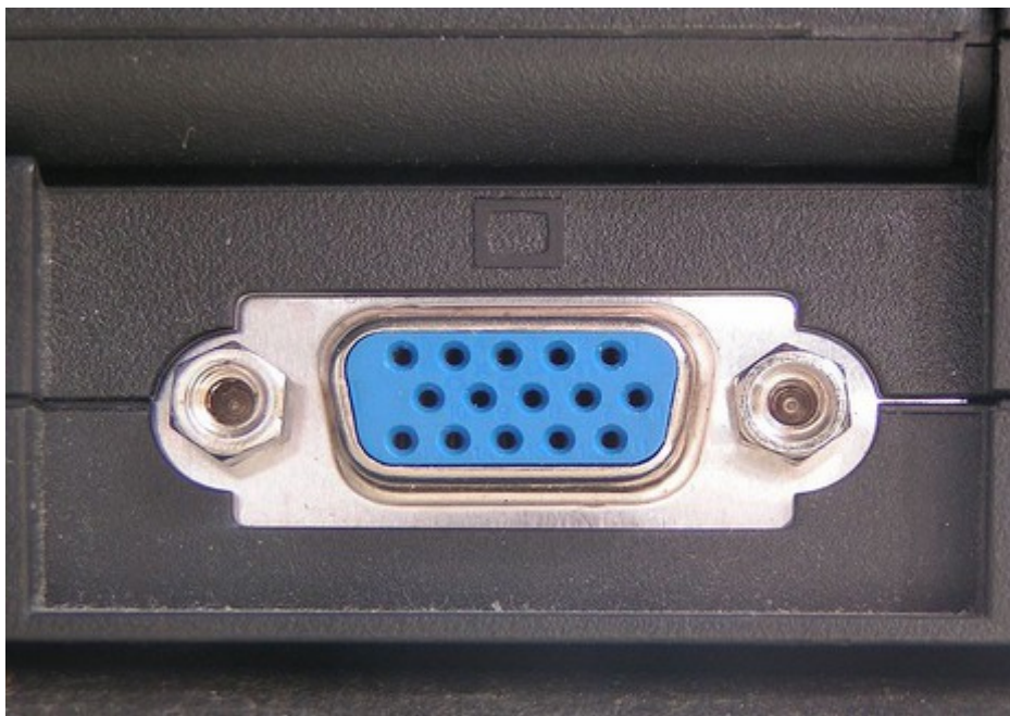
插图 1: VGA 接口

VGA 接口是比较老的电脑外接显示器接口，老一点的电脑大都支持，一般的台式电脑也都支持，许多轻薄型的新笔记本电脑可能就不再支持了。很多老一点的电视型号也都支持 VGA 接口。下图显示了 VGA 接口的形状：