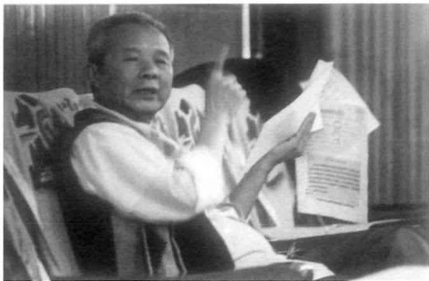
1986年5月在湖南召开新闻学会上的讲话