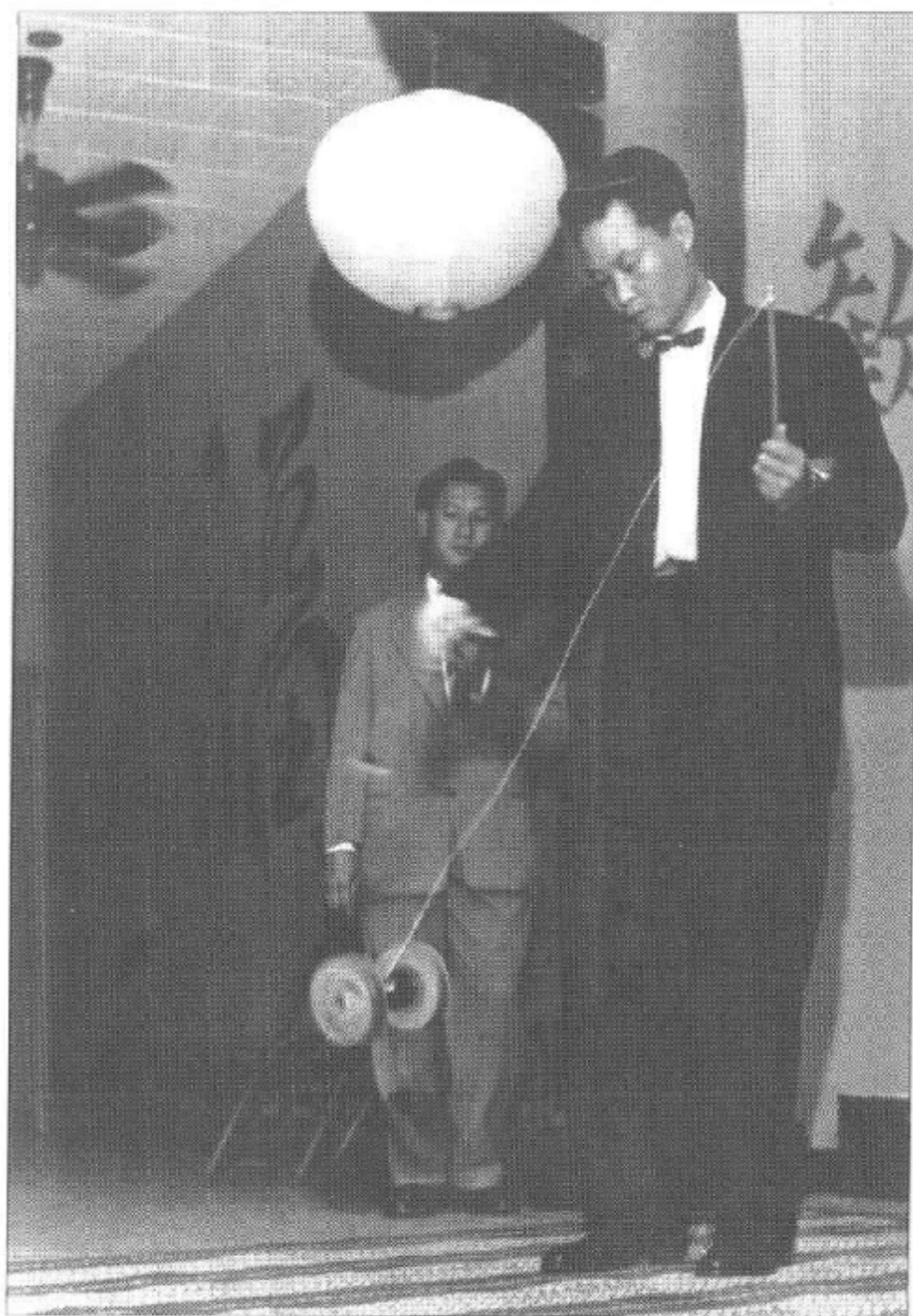
一九五三年 沖繩新年晚會中表演