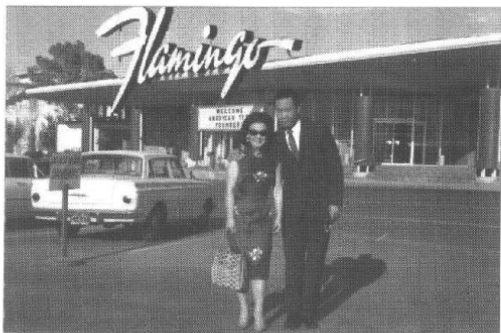
一九六三年 結婚渡蜜月