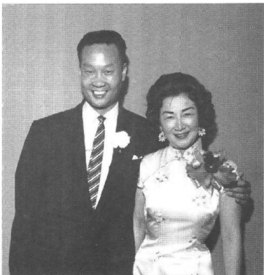
一九六三年 結婚宴客合影