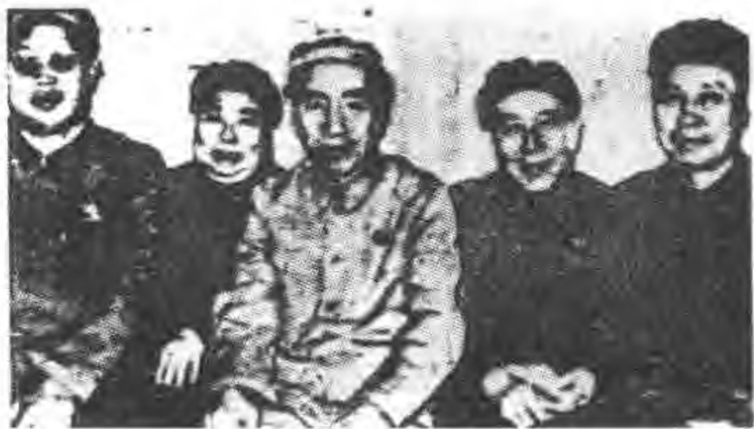
林彪及其亲信在江西九江机场合影 左起：李作鹏、吴法宪、林彪、黄永胜、邱会作