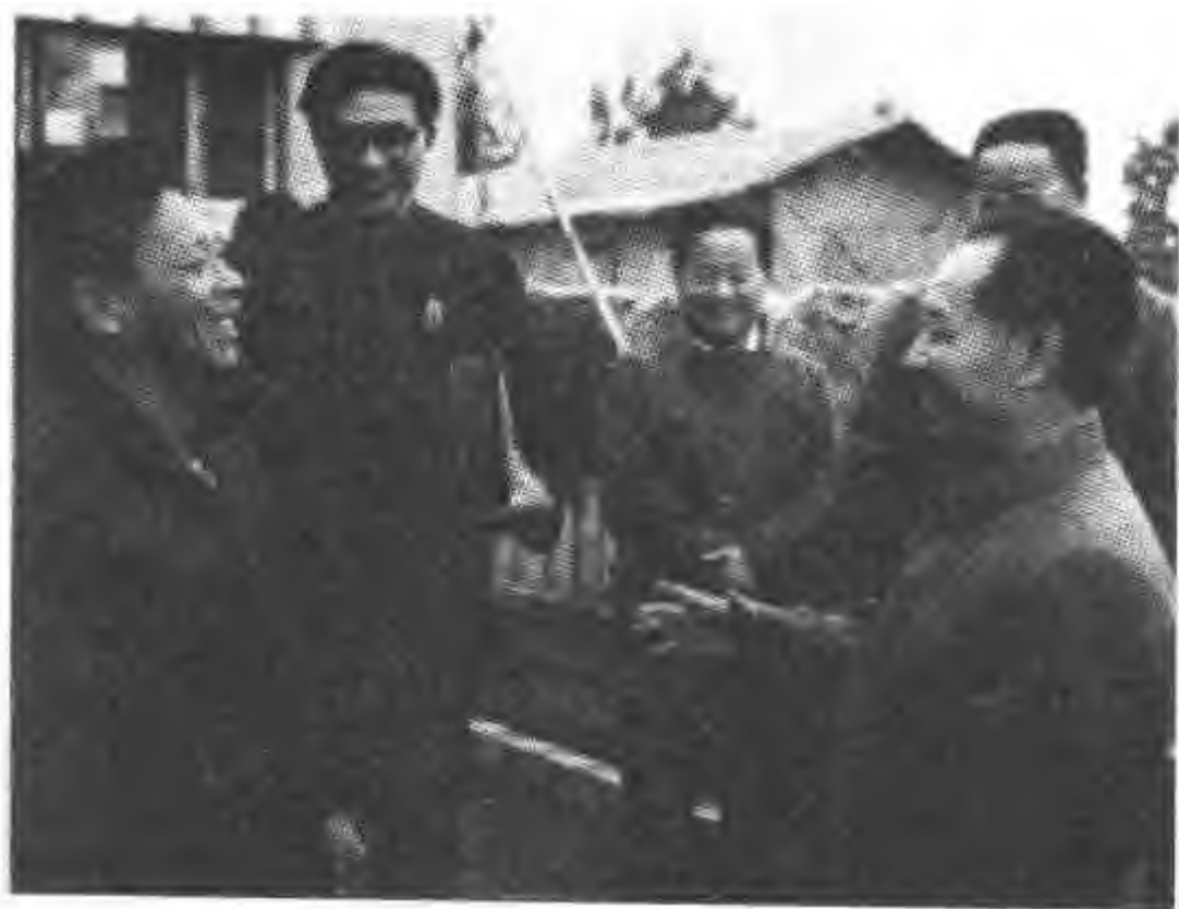
胡耀邦到基层考察