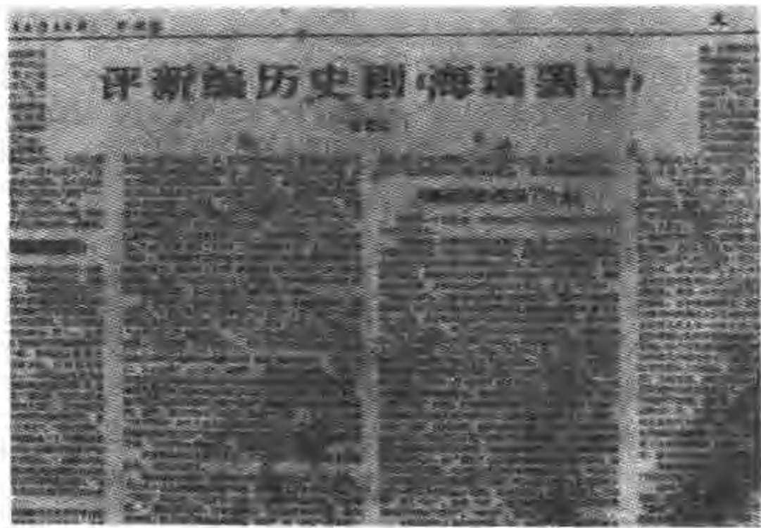
毛泽东批准发表的海瑞罢官

吴晗编剧的《海瑞罢官》上演于 1961 年冬,为什么事隔三年,国务院总理关心起此事来呢?原来,《海瑞罢官》上演不久,1962 年江青就找到中宣部和文化部的正副部长,提出要批判此戏,并称:“舞台上、银幕上……大量是资产阶级、封建主义的东西。”当时四位正副部长并没把此事看成某种信号而搁置一边。1964 年,江青又直接在北京找人写批判文章,颇有锣鼓日紧之势,尽管这次又无人肯写,却传入周恩来耳中,才向吴晗了解此事。吴晗遵嘱把写作《海瑞罢官》的始末原由写成报告呈交以后,认为此事也就了结。不料到了 1965 年春,又耳闻上海有人正在撰写批判文章。这使吴晗心情沉重起来。一天,他敲响北京市市长彭真办公室的门。