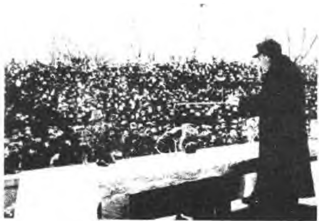
公安部长罗瑞卿作镇压反革命的动员报告

当罗瑞卿仍在外地时,听到总政反映,有许多单位建议将林彪关于突出政治的指示印成大张,张贴到连队。林彪已同意。罗瑞卿考虑再三,感到这个“指示”第一段提到叶群的名字不妥。因为叶群只不过是林彪办公室的主任,在军内并无重要职务,不宜过分突出。林彪知道后很不高兴,决定不印大张了。罗瑞卿得知这一消息,连忙表示:“那就照原样,不改。”林的答复是:“不改也不印了。”罗瑞卿知道此事又引起了林彪不满。