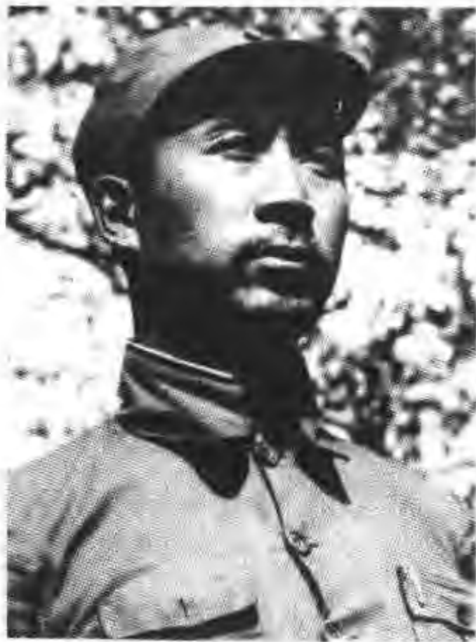
六十一人案的主角薄一波在七大

在胡耀邦领导的平反冤假错案的斗争中,最引人注目的一个重要案件,就是平反“文革”中轰动国内外的重大错案——“六十一人案”。所谓“六十一人案”,是指薄一波、刘澜涛、安子文、杨献珍、赵林、李楚离、廖鲁言、徐子荣、胡锡奎、刘锡五、王其梅等同志的所谓“六十一个叛徒”案。这个案子的主要内容是:在日寇势力蚕侵华北的1936年,经过中共中央的特殊批准,这批被关押在国民党北平监狱中的同志,在监狱主管者印好的“反共启事”上签字后离开监狱,重新投入了抗日斗争。