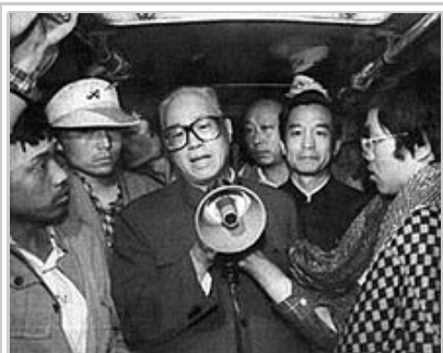
中共中央總書記趙紫陽來到天安門廣場與大學生們見面。后右二為時任中共中央辦公廳主任的溫家寶，溫家寶在2003年成為國務院總理。

趙紫陽披露鄧小平仍然為中共掌舵人後，鄧小平成為外界抨擊對象。5月17日，中共中央政治局常委在鄧小平家中召開會議，李鵬等常委把矛頭指向趙紫陽，認為局勢難以控制是他一手造成，並強烈要求採取果斷措施，終止學潮。之后邓小平提出要在北京戒严，并在五位常委分别表态后，正式确认了实行戒严的方案。 [65] 有說法 [66] 指趙紫陽當晚以「不能認同大多數常委意見」為由，提出辭去總書記一職。