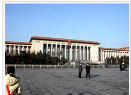
人民大会堂前的梯階上就是三名学生代表跪下的地方

一名身處在現場的香港記者的描述：「接近中午，學生代表決定，不提任何條件，只要求李鵬走出來與學生公開對話。早在四月二十日新華門前，群眾已曾高叫『李鵬出來』，但其一直未曾現身。在胡耀邦追悼會完結之際，廣場上的學生呼聲，同樣沒有得到他的理睬。不僅學生的呼聲李鵬不理睬，連學生在石階上跪著遞請願信他也不出來接，甚至廣場上群眾高呼『不對話，絕不走！』他亦堅拒對話。國徽之前，殿堂之外，女學生激動流淚，男學生悲憤握拳，有人發起狠要衝軍警的警戒線，軍警迫得後退。追悼會完結了，參加儀式的人群魚貫而出，不少人留在石階上，看到推擁的人群，看到請願的學生。一些知識分子出來，看見正跪著的學生，悲憤交集，一下子跪下來，擁抱著學生。《新觀察》主編戈揚老太太，氣得指著門前的警衛說：你們怎能這樣對待學生？三名代表跪了半小時後，纔獲准進內送花圈和請願書。」 [28]