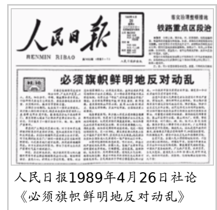
人民日报1989年4月26日社论 《必须旗帜鲜明地反对动乱》

過程中，中共嘗試將「極少數分子」與「廣大學生」劃下界線，申明四二六社論只針對「一小撮人」，但