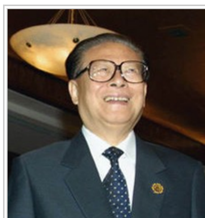
江泽民接替赵紫阳出任中共中央总书记，成为第三代领导核心。

李鹏同時主持趙紫陽批判會議，遭趙紫陽逐一駁斥 [169] 。虽然赵紫阳此后不能再露面，但这次政治遺言仍确立他在民主运动中的地位 [170][171] 。6月25日，《人民日报》头版以红色大字發行，標題為「党的十三届中央委员会召开第四次全会」，副标题长达172字：「审议通过李鹏代表政治局提出 关于赵紫阳所犯错误的报告 选举江泽民为中央委员会总书记 增选江泽民宋平李瑞环为政治局常委 增补李瑞环丁关根为书记处书记 撤销赵紫阳的总书记 政治局常委 政治局委员 中央委员和军委第一副主席职务 免去胡启立的政治局常委 政治局委员 书记处书记职务 免去芮杏文、阎明复的书记处书记职务 全会之前 中央政治局举行了扩大会议 为四中全会的召开作了必要准备」。 [168]