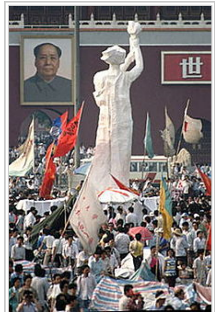
5月30日至6月4日聳立於天安門广场的民主女神，與城樓上的毛澤東肖像對望，象徵著民主與專制的較量。 [85]

6月2日，被稱為「天安門四君子」的劉曉波、周舵、高新、侯德健等主張撤離的知名人士宣佈在天安門絕食72小時，籲學生和政府重新開展和平對話 [73] 。