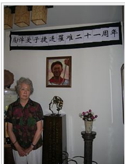
丁子霖，天安門母親運動發起人