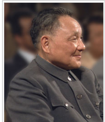
中国共产党第二代领导核心邓小平

在社會不安氣氛下，1989年4月15日，前中共中央主席、中共中央總書記胡耀邦以73歲之年猝逝，加劇了緊張局勢。胡耀邦被視為開明派的代表人物，1986年中國科學技術大學學生發起抗議社會弊端的學潮時，他對學生與知識分子表達同情，被中共元老們視為軟弱表現，翌年1月因「反對资产阶级自由化不力」，被指違反中共的集體領導原則 [8] ，胡耀邦請求中央批准他辭去中共中央總書記的職務 [9] ；1987年，中共中央號召全黨全國堅決反對資產階級自由化 [8][10][11] 。