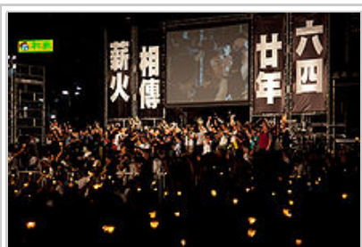
20年後香港的維園六四燭光晚會

中國在經歷了「六四」二十幾年後，在政治方面，當年提出的民主化改革有進步，但仍是一黨專政，基層一般沒有實行民主選舉，民間存在政治體制改革的呼聲（關於政治體制的問題，溫家寶先生接受CNN採訪 ( http://www.youtube.com/watch?v=wUpcQSJ0tTE&feature=related ) 時曾經提到）；在經濟方面，中國大陸的經濟建設取得了一定的發展，但問題同時也存在。部份工人與農民的利益受到了地方政府及財團的侵害，部分地方政府與財團相互勾結。在中國大陸，曾先後發生了富士康事件和烏坎事件。中國大陸的官方對經濟發展的形勢是看好的，但是社會上也有人對當下的中國經濟持悲觀態度。在網絡上流傳一段具稱是朗咸平演講