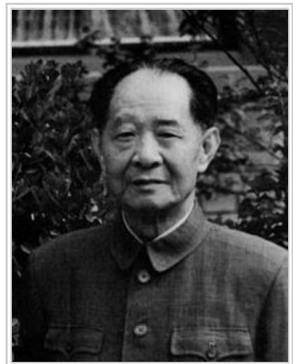
胡耀邦，曾經擔任中共中央主席和中共中央總書記

外界密切關注胡耀邦去世可能產生的影響。其中美聯社、路透社均認為胡的猝逝不會對政局產生重大影響，因為胡早已離開權力中心，但一些日本媒體則認為有可能影響中國政局。4月16日《東京新聞》發表一篇題為《胡的追悼活動是注意的焦點》，文章說：「追悼胡的活動帶有強烈的政治色彩。如果黨和政府對追悼活動草率從事，很可能激怒民眾。」同日，日本時事社指出適逢五四運動七十週年，民眾不滿通脹和官員特權等弊端，民主的呼聲在學生之間高漲：「胡氏逝世會否引發類似天安門事件，正受人關注。」 [13]