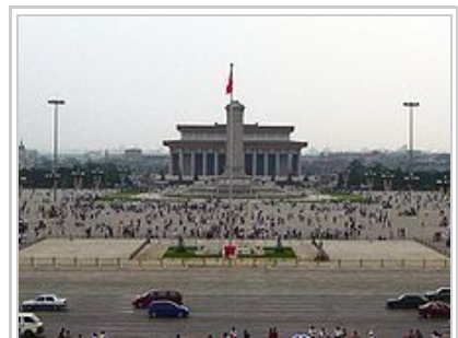
天安门广场是1989年学生绝食静坐長達三週的地方