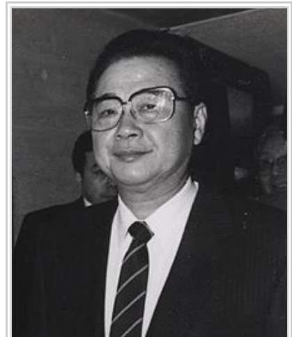
李鵬，时任中共中央政治局常委和国务院总理

戒嚴期間，廣場仍有逾十萬民眾聚集，記者仍然在採訪。市郊雖有零星流血衝突，但軍隊接到「打不還手，罵不還口」的命令，衝突並不嚴重，也有不少民眾向軍人送水送糧、慰問軍人，勸他們放下武器。一些士兵流淚，一些顯得不知所措，事後盛傳有軍長級幹部因拒絕執行戒嚴令而被撤職 [71] 。